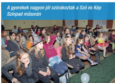
A gyerekek nagyon jól szórakoztak a Szó és Kép Színpad műsorán

Szellemkeresés, fogsorfaragás, tarantulaevés, vér- (málnaszörp-) ivás. Ilyen és hasonló programokkal mulattuk az időt, míg meg nem érkezett a Szó és Kép Színpad, akiknek vadvacsorákból összeállított műsorán jól szórakozott mindenki.