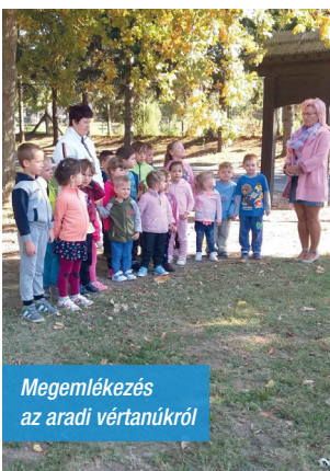
Megemlékezés az aradi vértanúkról