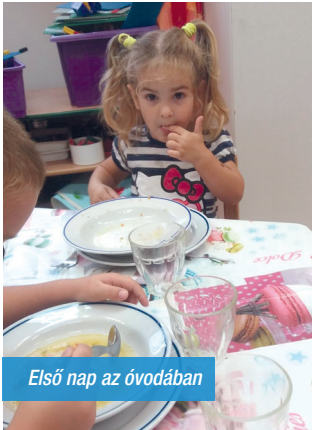
Első nap az óvodában