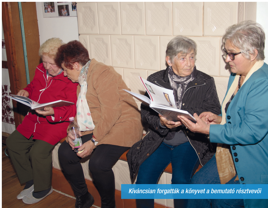
Kíváncsian forgatták a könyvet a bemutató résztvevői

önzetlenül részt vettek a társadalmi munkában, a szervezésben, vagy akár más módon, például földtulajdonuk felajánlásával járultak hozzá az egyesület, a koncertek sikeréhez.