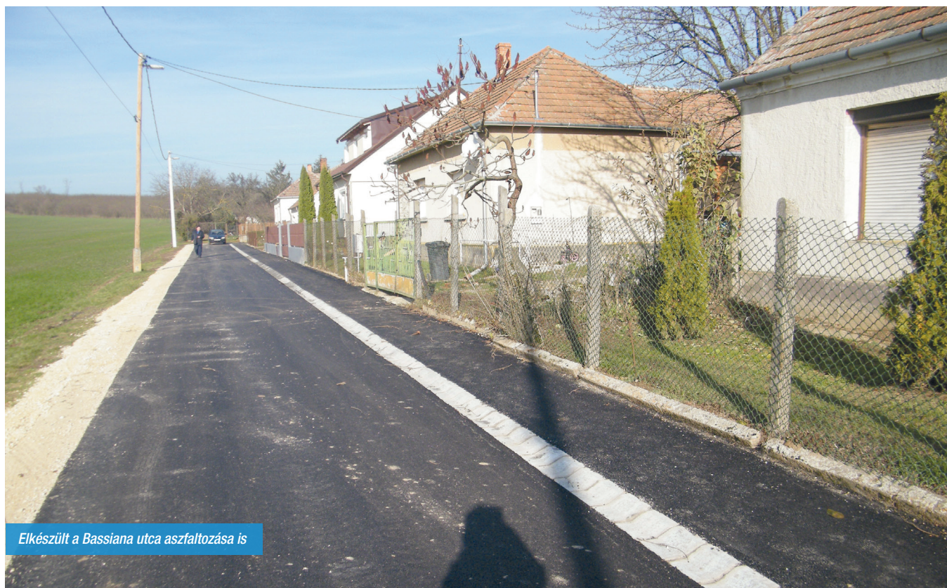
Elkészült a Bassiana utca aszfaltozása is