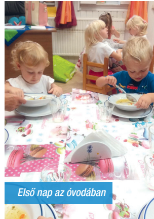
Első nap az óvodában