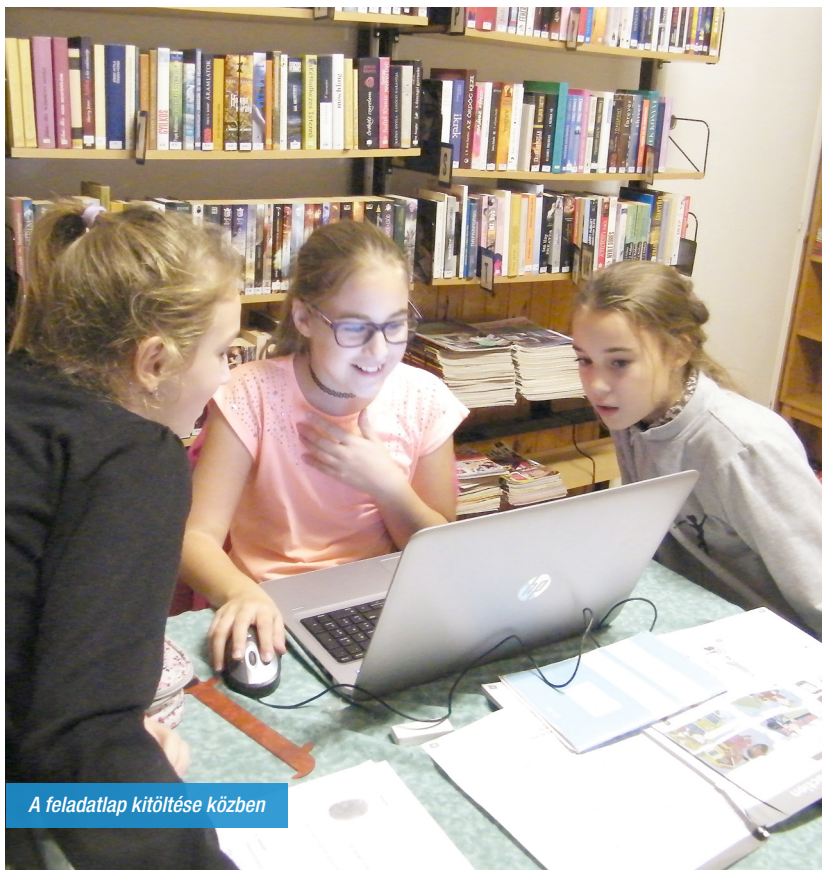
A feladatlap kitöltése közben