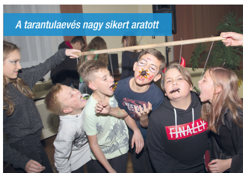
A tarantulaevés nagy sikert aratott

Itt nem csak vidám vetélkedők, trambulín, kézműves foglalkozás várta a gyerekeket, hanem Paprika Jancsi Bábszínházában is jól szórakozhattak. De nem maradhatott el a szőlődarálás, préselés után a finom, édes must kóstoltatása sem. Voltak olyan gyerekek is, akik alig várták, hogy az előadás után pattogjon a futball-labda, és egy jót focizhassanak. A lényeg, hogy mindenki jól érezte magát.