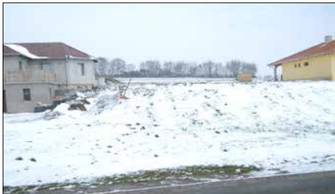
Értékesítésre került az utolsó önkormányzati telek

Sitke Község Önkormányzata Képviselő-testülete január-februári képviselő-testületi ülésein módosításra került az önkormányzat 2017. évi költségvetéséről szóló önkormányzati rendelete, elfogadásra került az önkormányzat 2019–2021.