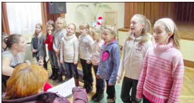
Az adventi műsor előtti próba

Bár még mindig a fő irány a miséken való részvétel és éneklés, azért már több, egyéb fellépés is színesítette a kis csoport életét, melyekkel láthatóan a sitkei lakosoknak is örömet szereztek.