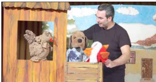
A bábelőadás nagy élmény volt mindenkinek

Advent első vasárnapján minden korosztály megtalálhatta a magának való programot. Kettő órától a kicsiket vártuk a művelődési házba, az Ákom-Bákom Bábcsoport Mikulás a