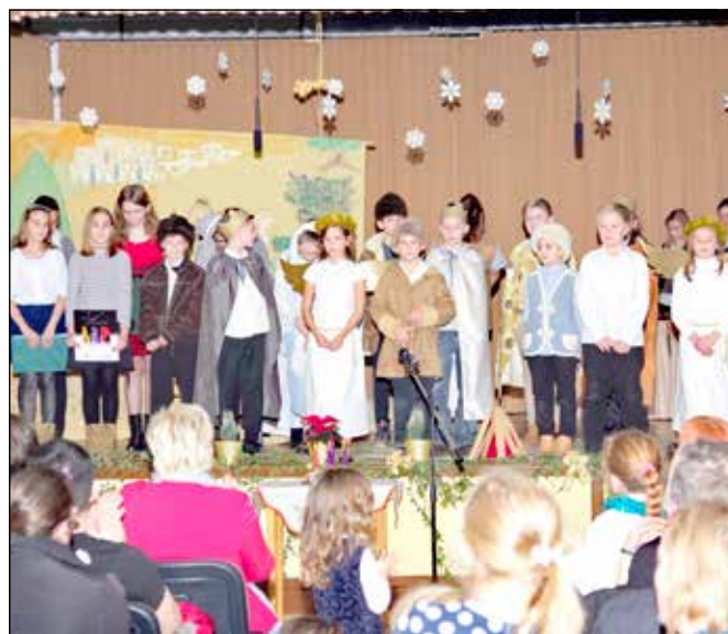
A betlehemezők csoportja

Mint minden évben, a tavalyi évben is készültünk betlehemes-sel, melynek előadásáért a gyerekek csak dicséretet érdemelnek.