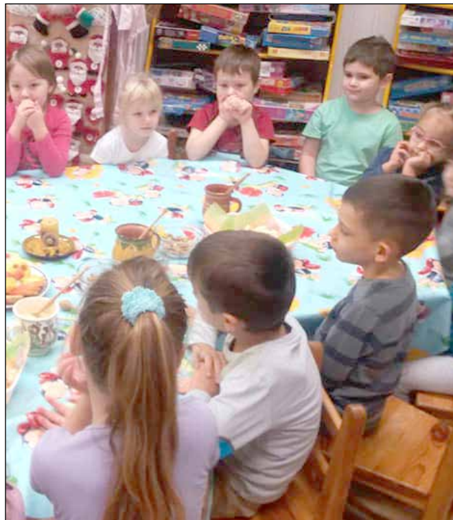
Vajon melyik méz lesz finomabb?

gyerekek kérdezhettek, és a válaszokból kiderült, hogy mennyi mindent köszönhetünk ezeknek az aprócska, szorgos kis