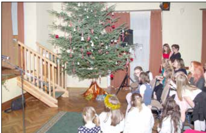
A falu karácsonyfájára sokan hoztak saját maguk által készített díszeket

Minden év végén nagy izgalommal készülünk karácsony ünnepére, hisz talán ez az az ünnep, amely mindenki szívét megdobogtatja. A gyerekekkel már novemberben egyezkedünk, ki milyen szerepet vállalna szívesen. Szerencsére mindig egyezségre jutunk, sőt büszkén mondhatom, hogy általában még plusz szerepeket kell keresni, hogy mindenkinek jusson. Így volt ez tavaly is, nagyon sok gyerek lépett fel az év utolsó ünnepségén.