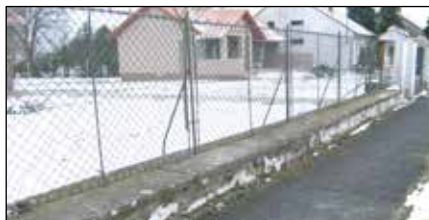
A művelődési ház kerítésének felújítása is a közeljövő feladata lesz

– Az önkormányzatnak minden évben nagy kihívást jelent a zöld területek gondozása, sok munkát igényel. A Nyugdíjas Klub támogatása nélkül nem lehetne rendben tartani a parkot és a temetőt, remélem, hogy a jövőben is lehet számítani a segítségükre. Régi adósság a Vadkert utca kis szakaszának kivilágítása, a járdához kellene még pár oszlopot telepíteni, mert jelenleg világítás nélkül nagyon sötét ez a szakasz, így a gyalogosok számára balesetveszélyes. A művelődési ház nagytermében a parketta nagyon rossz állapotban van, ennek a felújítása időszerű lenne, vagy saját erőből, vagy ha megoldható, akkor pályázati pénzből.