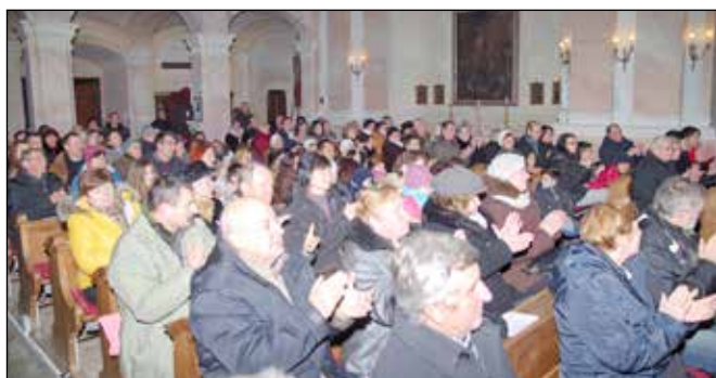
Zsúfolásig megtelt a templom a koncertre

A parki ünnepség után a Szentháromság-templomba invitáltunk mindenkit a Ma'mint'Ti Színjátszó Csoport hang-