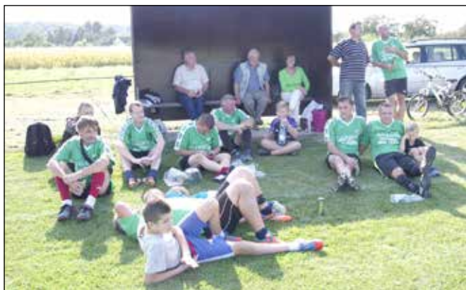
Az öregfiúk csapata a felújított kispad előtt a Halhatatlanok tornáján

– Volt egy társadalmi munkánk a nyáron, ami nagyon jól sikerült, elég sok dolgot meg tudtunk csinálni: a pálya körül rendet raktunk, a kispadokat lefestettük, a régi tribünöket felújítottuk.