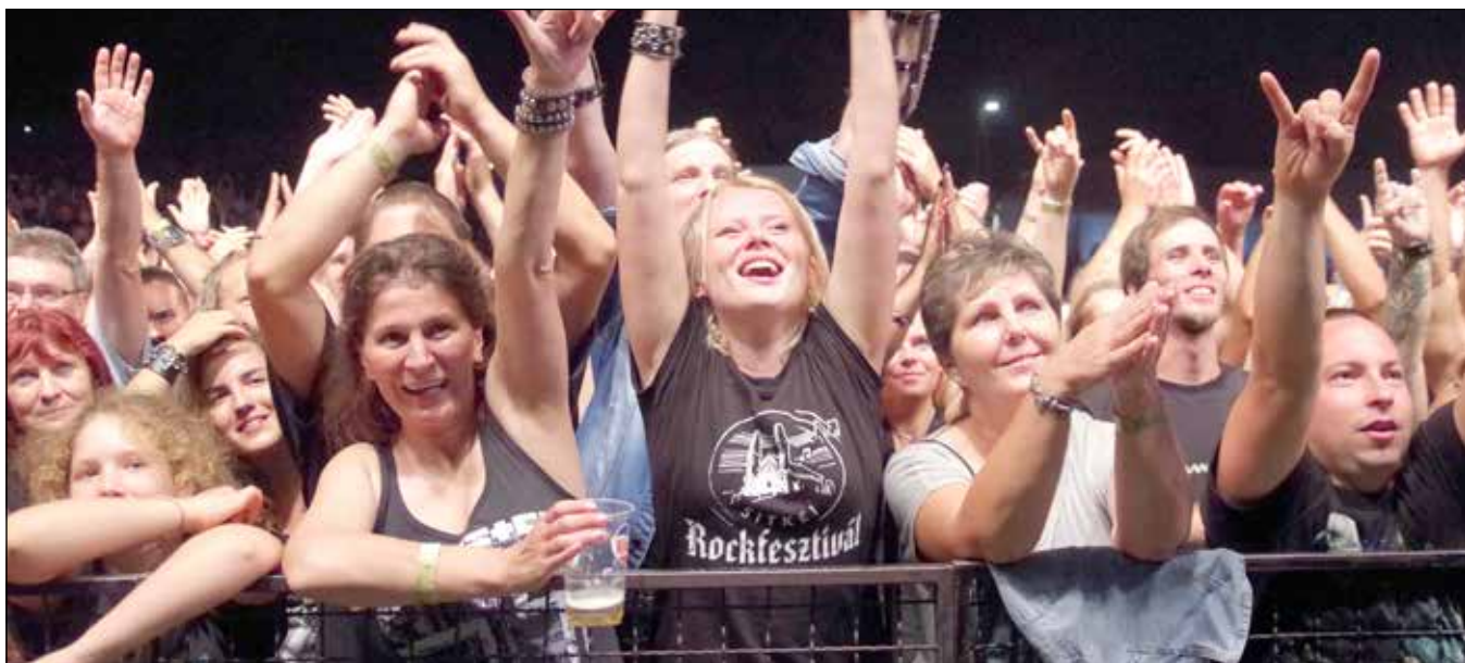
Reméljük, idén kétszer is megtelik a domboldal

Idén van a Kápolnáért Kulturális és Sportegyesület megalakulásának 30 éves évfordulója. A jubileum alkalmából az elnökség két napos koncert megtartásáról határozott, melynek időpontja: augusztus 24–25.