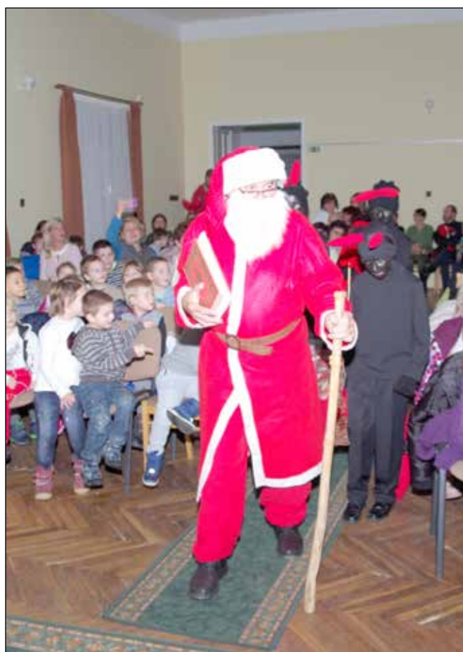
A Mikulást a krampuszok is elkísérték