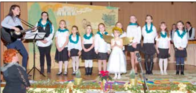
Karácsonykor is elragadó műsort adtak

2017 decembere szereplések terén különösen erős volt. Énekeltek az első adventi gyertya meggyújtásakor, az időseknek szervezett ünnepségen, és természetesen a csúcspont a falu karácsonya volt, amire egy igazán színvonalas, verses-énekes műsorral készült a csoport.