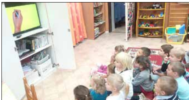
Filmvetítés a méhek életéről

rikákra csurgatva kínáltuk. Játsoztunk is egyet. Hogy melyik méz ízlett a legjobban? A csuprok mellé rakott piros szívecskék megmutatták. A kóstolás után az ovisok méhecske ujjbábát színezték és vágtak ki. Az ügyesebbek rajzokat is készítettek.