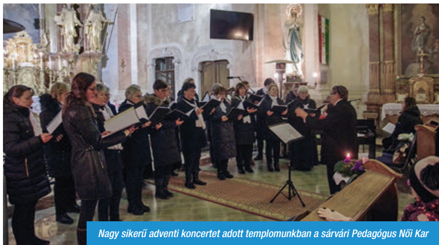
Nagy sikerű adventi koncertet adott templomunkban a sárospataki Pedagógus Női Kar

Advent első vasárnapján szívet melengető és békét hozó dallamok csendültek fel a sárospataki Pedagógus Női Kar előadásában a római katolikus templomban. A kórus a Kápolnáért Kulturális és Sportegyesület meghívására látogatott el Sitkére, ünnepi műsorral ajándékozta meg a község és a térség lakóit.