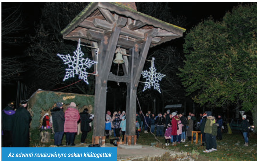
Az adventi rendezvényre sokan kilátogattak