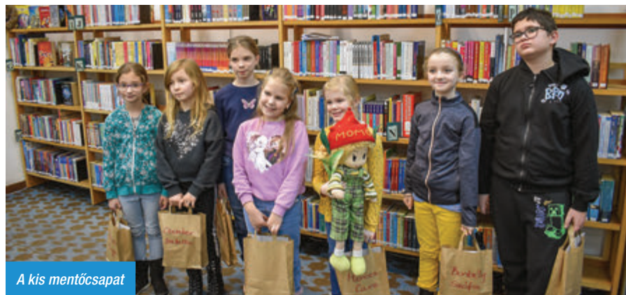
A kis mentőcsapat

Meseország lakói újra biztonságban vannak, hiszen Momó a gyerekek segítségével ismét legyőzte a csintalan koboldokat. A gyerekek