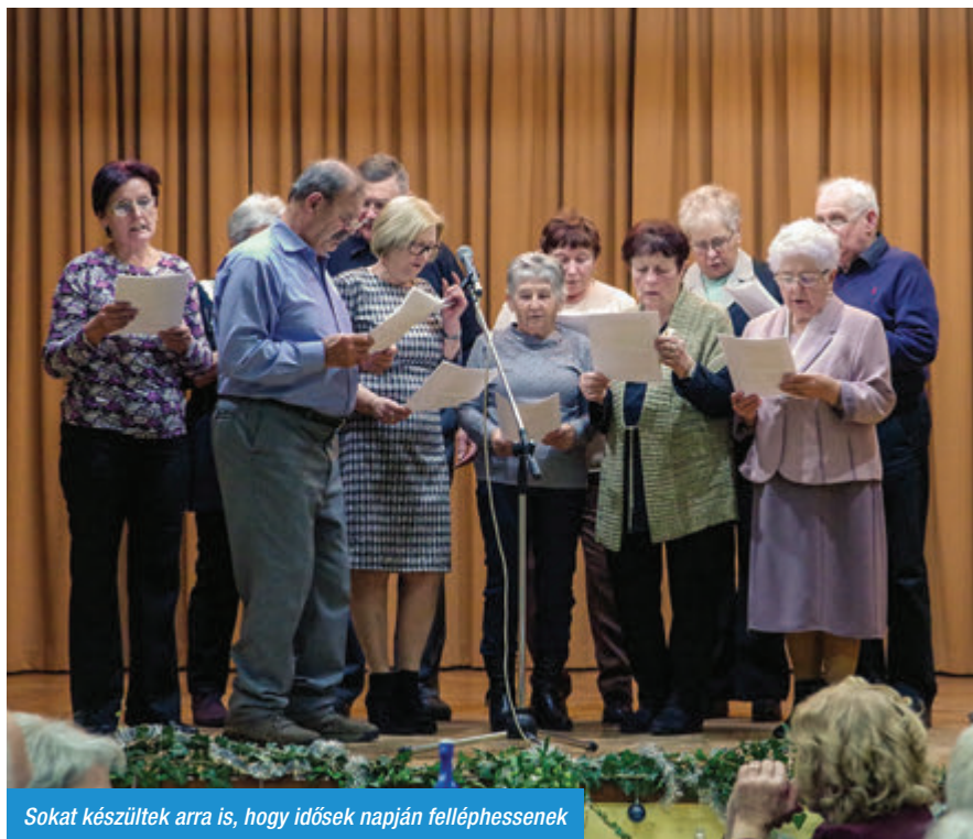
Sokat készültek arra is, hogy idősek napján felléphessenek

Budapest után a forró nyári napok miatt következő kirándulásunkat szeptemberre terveztük. Busszal indultunk Bakonybélre és Pápára. Kellemes időben és rengeteg látnivalóban volt részünk.