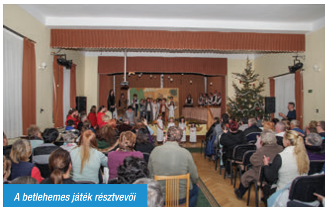
A betlehemes játék résztvevői