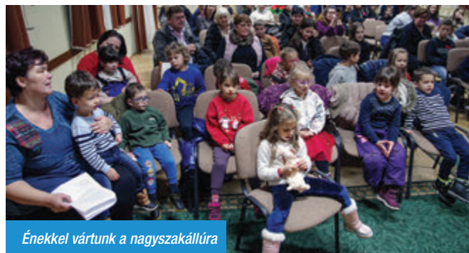
Énekkel vártunk a nagyszakállúra