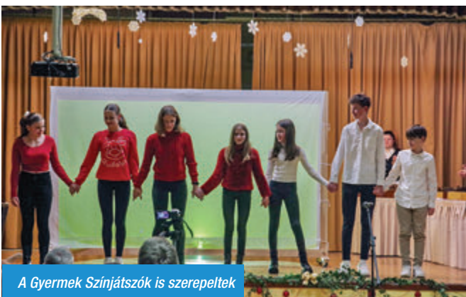
A Gyermek Színjátszók is szerepeltek