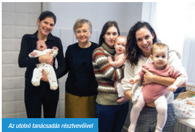
Az utolsó tanácsadás résztvevőivel