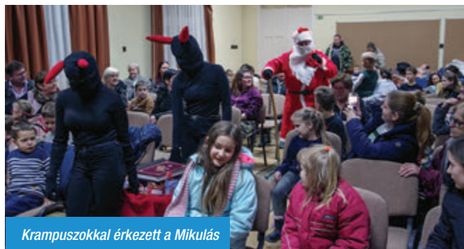
Krampuszokkal érkezett a Mikulás

A gyerekek sok szép verssel, énekkel készültek, így hamar kiürült a Mikulás zsákja.