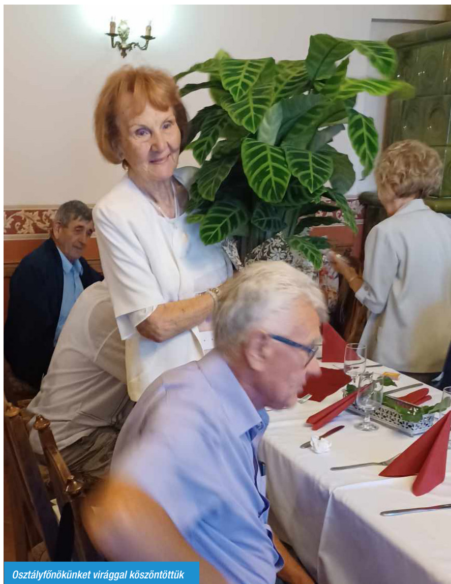
Osztályfőnökünket virággal köszöntöttük

Melegségre vágyunk, mert didereg a lelkünk háborús időkben!