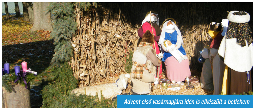
Advent első vasárnapjára idén is elkészült a betlehem