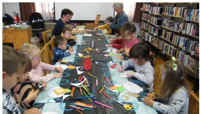
A Magyar népmese napján filmvetítés és kézműves foglalkozás várta az ovisokat a könyvtárban