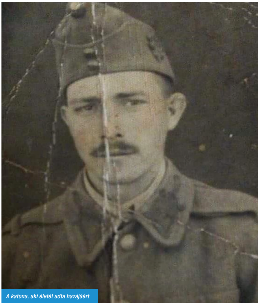
A katona, aki életét adta hazájáért

kor a meleg konyhában ültek a sparhert előtt, és kukoricát morzsolgattak, vagy tolat fosztottak. A tűzhely tetején krumplicsütl, néha szalonna is, illatával betöltve a csöppnyi helyiséget, a lámpa kerek foltja alatt pedig a család kuporgott sámlin vagy kisszéken, fejük összehajolva a fénykörben, kezük néha összeért a munka fölött. A katona nagyon szerette ezeket az estéket, mert együtt voltak, és mert anyja ilyenkor mesélt. Történeteiben egybeolvadt mese és valóság, és a meleg. Anyja kedves, duruzsoló hangja néha álomba ringatta, ilyenkor aztán apja erős karjába vette, és vitte, mint egy kiscsibét, hogy aztán lefektesse, takargassa óriás dunának közé. Talán erről álmodott most is, mert szája sarkában édes nyál csillant, fáradt arcának barázdáiban könnypatk eredt. A nap lassan a látóhatár alá szállt, sötétedni és hűvösödni kezdett. A katona megmozdult, elgémberedett tagokkal próbált felébredni. Mindene fájt mostanra, ruhája fakéregként burkolta a testét. Sár, vér szennyezte, azóta nem volt kimosva, mióta a katona otthon járt,