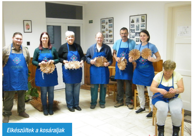
Elkészültek a kosáraljak