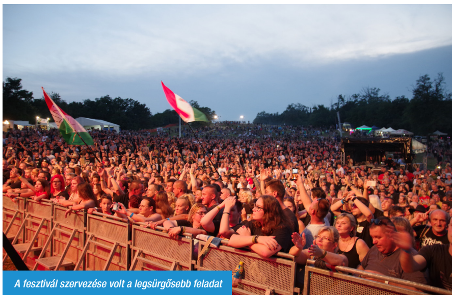
A fesztivál szervezése volt a legsürgősebb feladat

– Az egyesület továbbra is szervezi a megszokott programokat, célul tűztük ki, hogy ezen a területen is aktívabbak legyünk, több programot szervezzünk. Úgy gondolom, hogy lehetőségeinkhez mérten sikerült elindulni ezen az úton. Megszerveztük a hagyományos adventi koncertet, tavasszal fesztivál-beharangozó sajtótájékoztatót tartottunk, majd kiállítás rendeztünk a kápolnában. Nyáron a nagyrendezvényeinkre, a rockfesztiválra