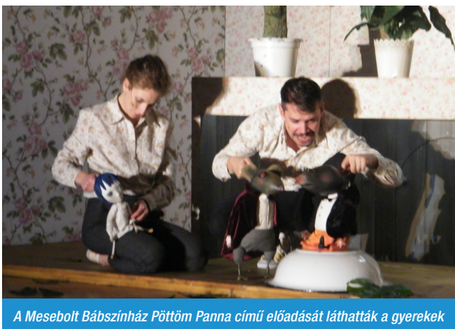
A Mesebölt Bábszínház Pöttöm Panna című előadását láthatták a gyerekek