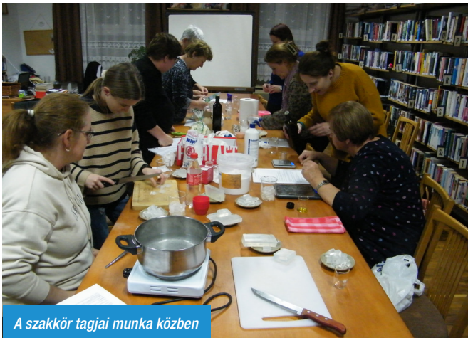
A szakkör tagjai munka közben