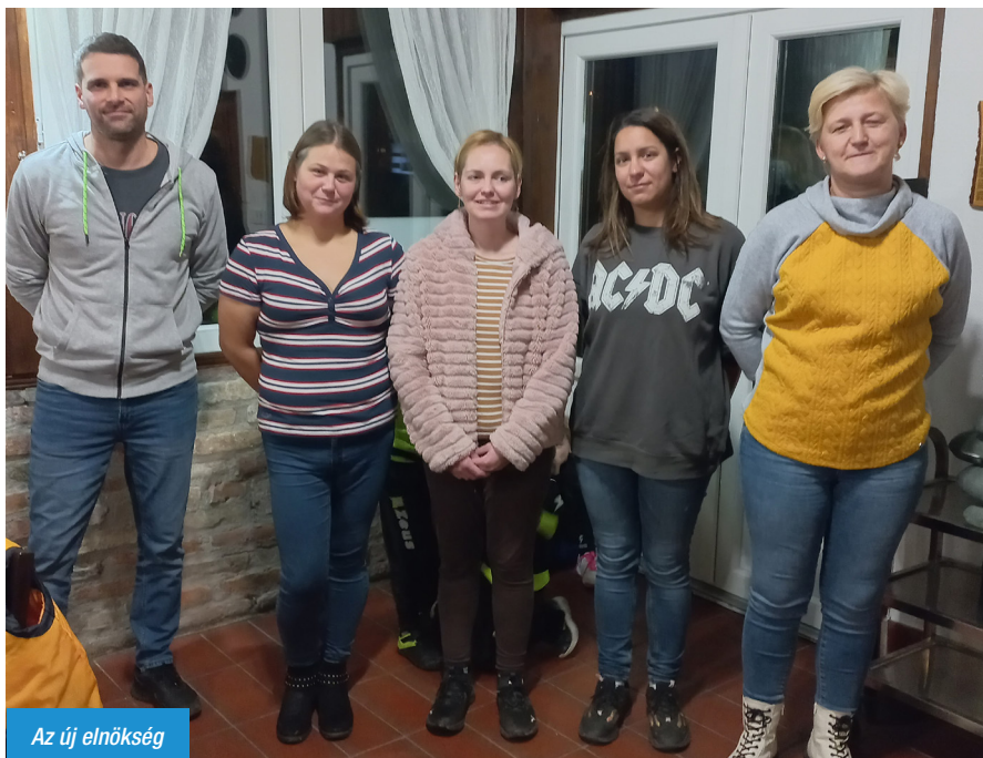
Az új elnökség