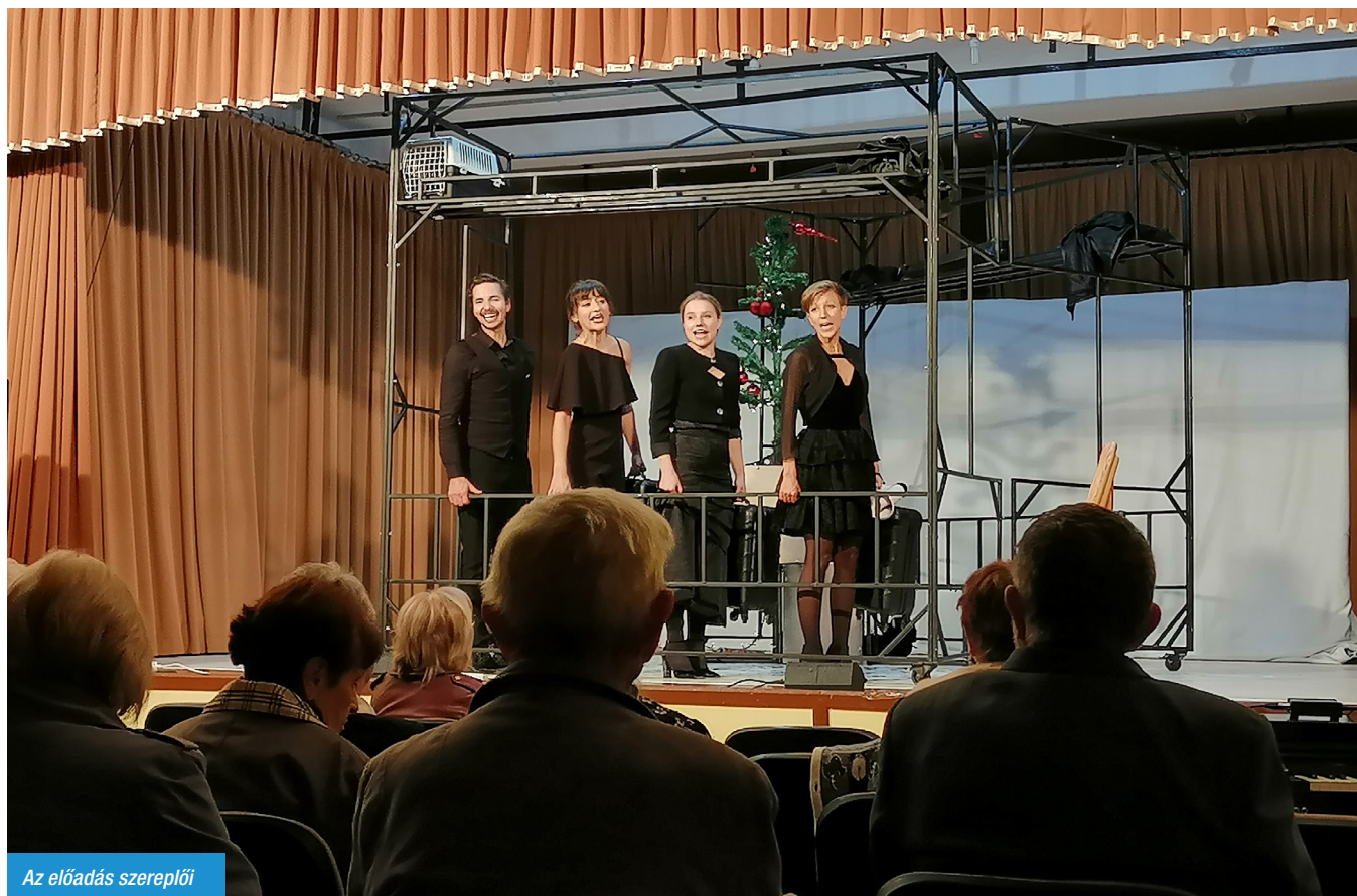
Az előadás szereplői

Általában azt tartják, hogy az a falu, ahol nincs orvos, megszűnik az óvoda, iskola, előbb-utóbb elnéptelenedik. Ugyanerre a sorsra jut akkor is, ha a közösségi és kulturális élete hal el. Sitke azon szerencsés községek egyike, ahol mindez rendelkezésre áll. A helyi kultúrház egész évben számtalan programot kínál, és ezek egyikén vehettünk rész október 28-án: a Soltis Lajos Színház Magyar Álomvasutak című előadásán.