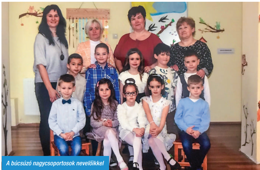
A búcsúzó nagycsoportosok nevelőikkel

Nagysoportosok vagytok, iskolába készültök. De nagyon gyorsan elszaladt ez a három (négy) év, amit itt töltöttetek nálunk! Soha nem felejttem el azt a napot, amikor először jöttetek óvodába. Volt, aki az első pillanattól úgy viselkedett, mintha világegyetemben óvodába járt volna, volt, aki lassan, óvatosan fedezte fel előbb a csoportszobát, majd az udvart, volt, aki egész nap az óvó néni ölében akart ülni, s bizony volt olyan is, aki sírva kapaszkodott az anyukájába. Ölegettük, vigasztalgattuk a sírókat, biztattuk a félénkeket, óvtuk azokat, akik túllontúl bátornak mutatkoztak, s közben