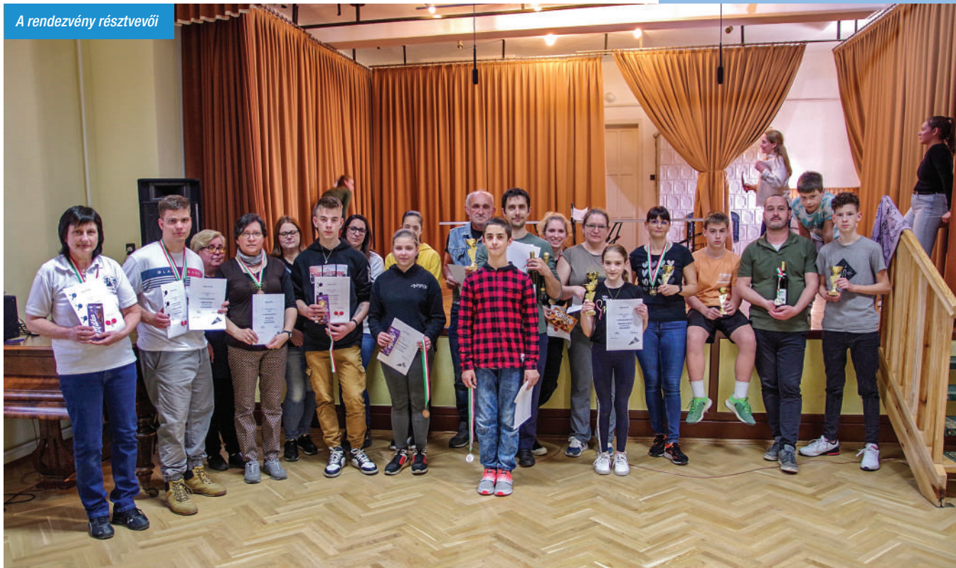
A rendezvény résztvevői