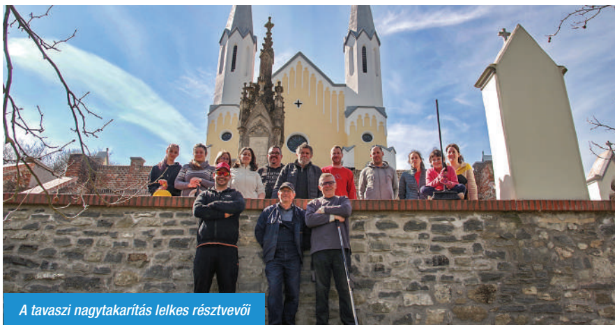
A tavaszi nagytakarítás lelkes résztvevői

A társadalmi munka alkalmával újabb szemeteseket telepítettünk a kálvária környékére a zöldterületek tisztán tartása, környezetünk megóvása érdekében. Öt darab kültéri szemetest helyeztünk el a kápolna mellett, illetve szerte a domboldalon.