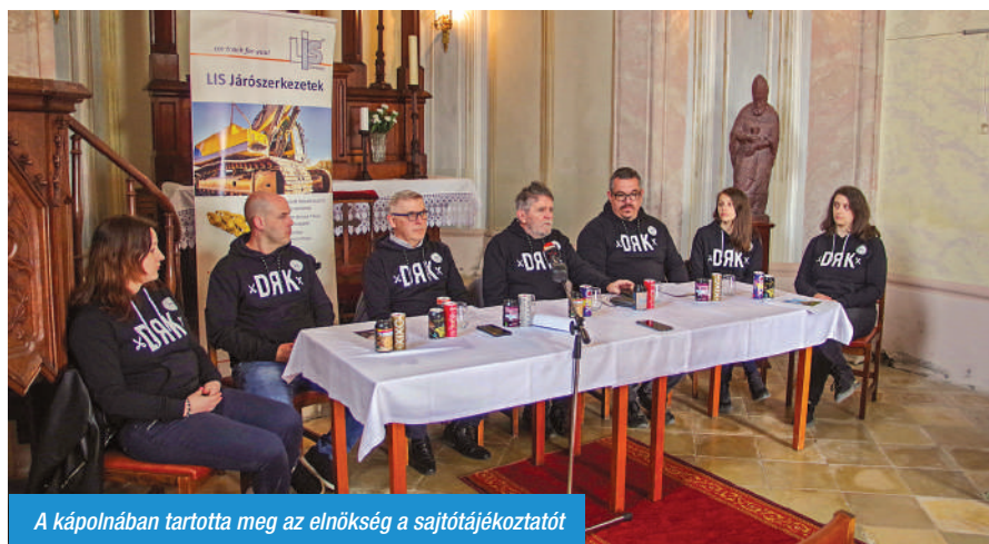
A kápolnában tartotta meg az elnökség a sajtótájékoztatót

A 35. Sitkei Rockfesztivál jubileumi programját sajtótájékoztató keretében ismertette a kápolnás egyesület elnöksége a nagyközönséggel. Régi ismerősök, jubiláló együttesek, új arcok is érkeznek az országos hírű rockfesztiválra 2023. augusztus 25-26-án. A színvonalas felhozatal mellett számos újdonsággal is készülnek.