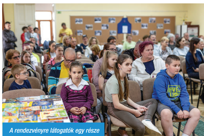
A rendezvényre látogatók egy része