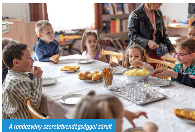
A rendezvény szeretetvendégséggel zárult