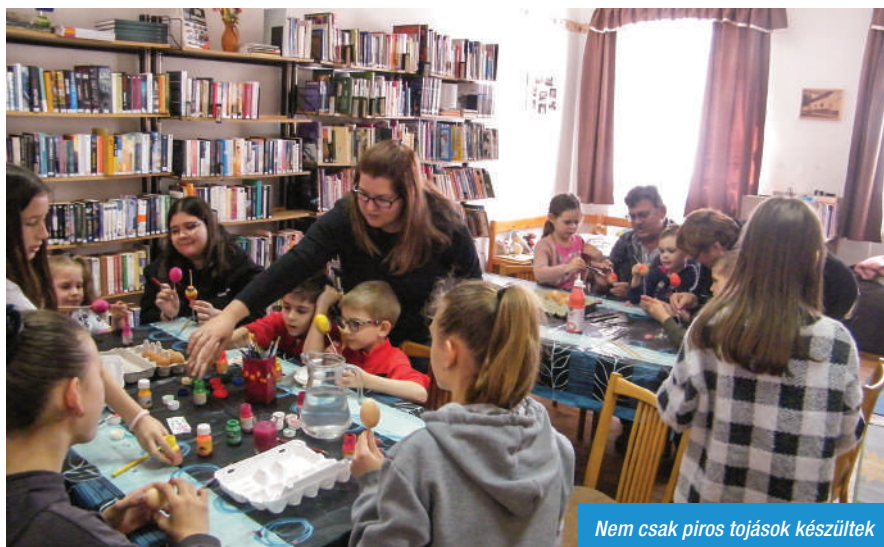
Nem csak piros tojások készültek