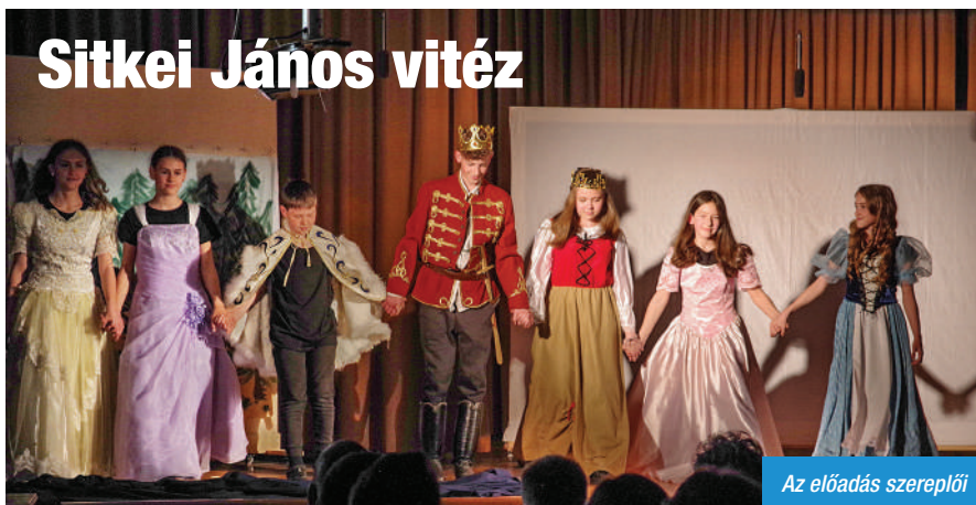
Az előadás szereplői

A művelődési házban május 14-én volt a premierre a Sitkei Gyermek Színház szók előadásában a Sitkei János vitéz