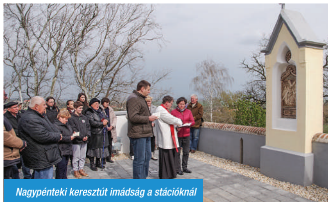
Nagypénteki keresztút imádság a stációknál