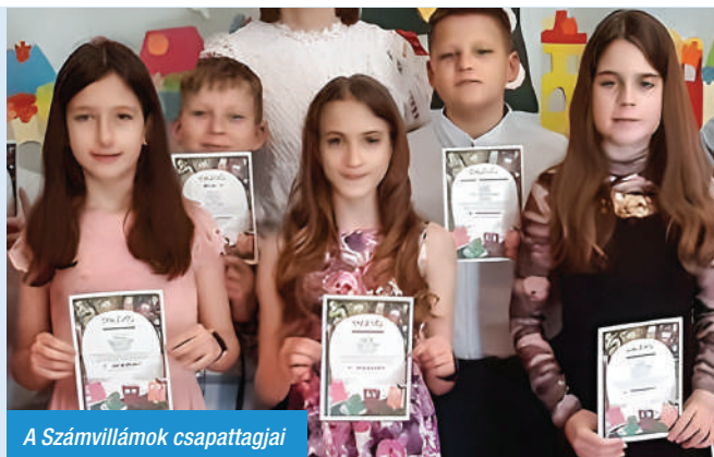
A Számvillámok csapattagjai