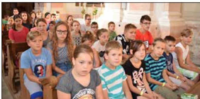
A táborban résztvevő sitkei gyerekek egy csoportja