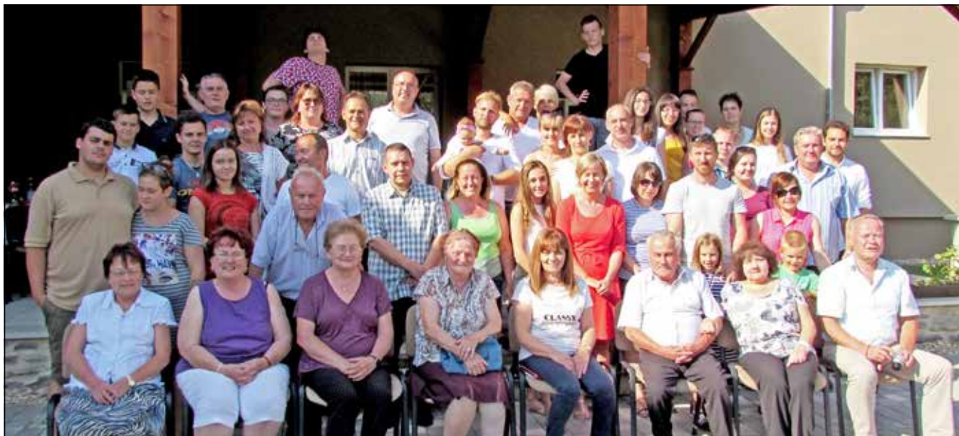
A Kovács család