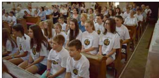
A táborzáró misén megteltek a padok a gyerekekkel és szüleikkel