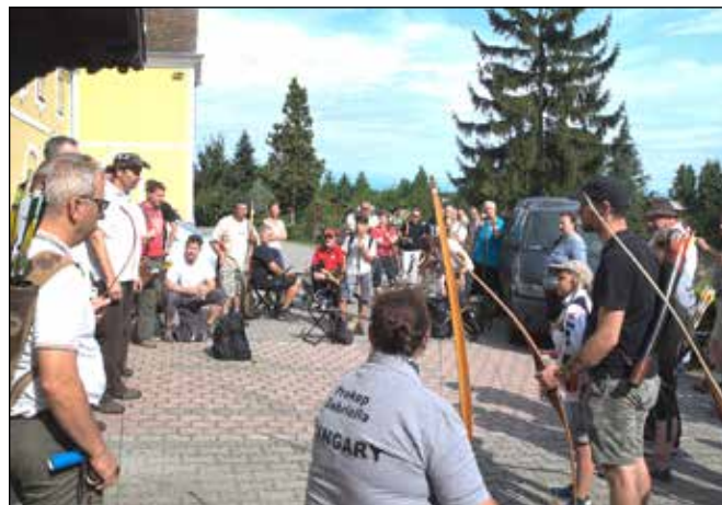
A versenyzők a Kastélyfogadó kertjében gyülekeztek a verseny előtt