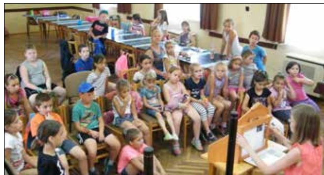
A kézművesek Meseláda foglalkozáson is részt vehettek a Vas Megyei KSZR támogatásának köszönhetően