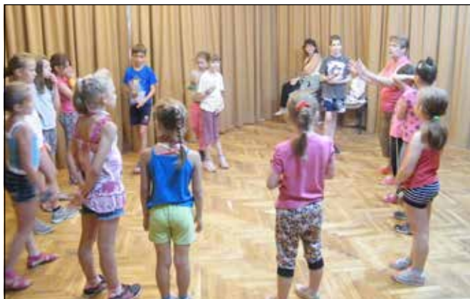
Oti néni drámajátékokat játszott a kisebbekkel

A kisebbek drámajátékai a következőképpen épültek fel: