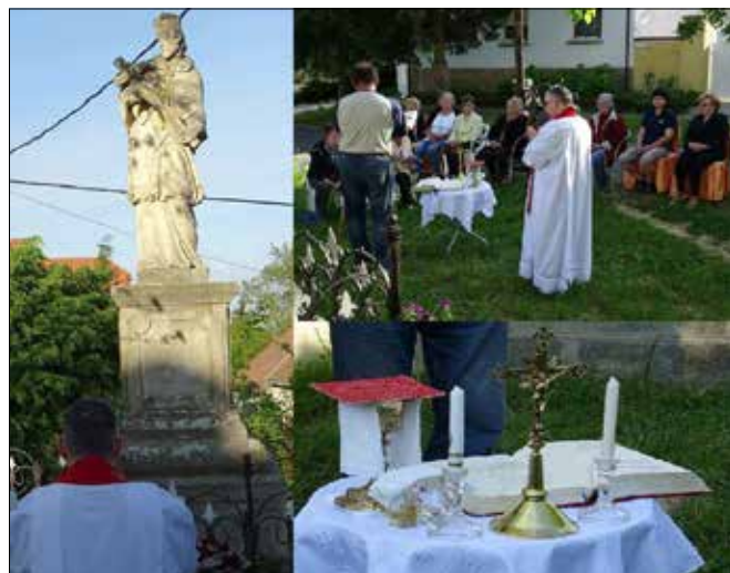
Pillanatképek az utcai szentmiséről

Ő a gyónási titok védőszentje! Ez olyan, mint az orvosi vagy az ügyvédi titoktartás, csak ez még szent is. Amiért meg is lehet halni, mert a sirig tart. Sokakat visszatart a szentgyó-