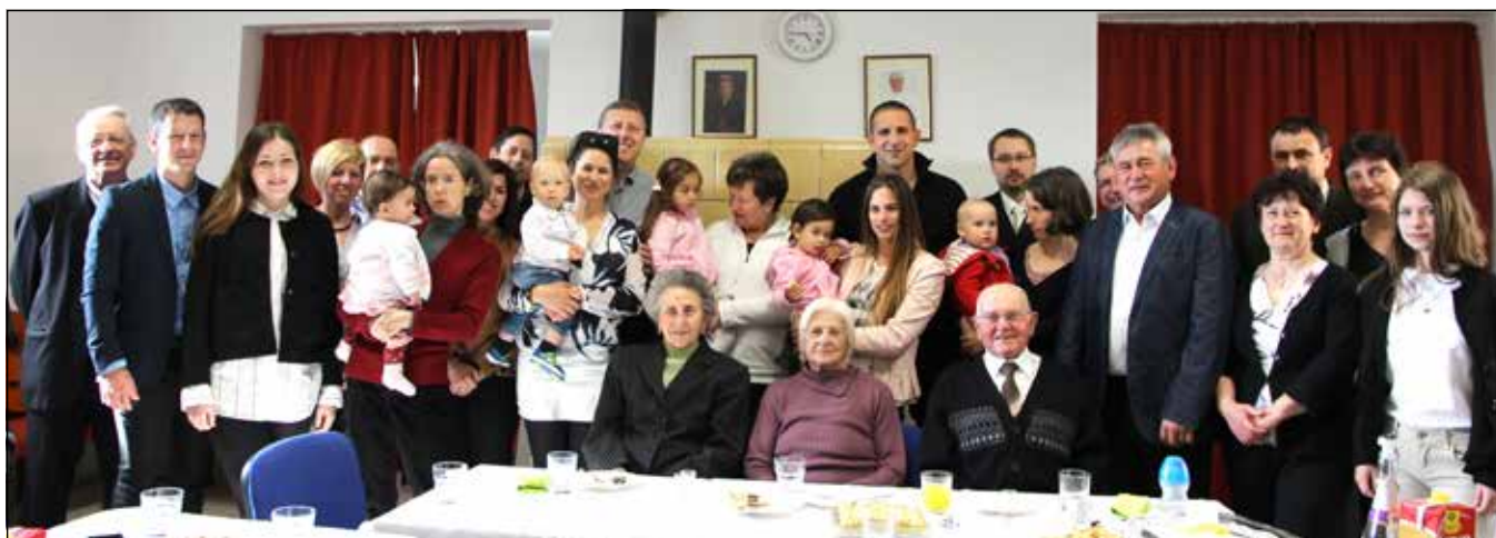
A Kéthelyi család