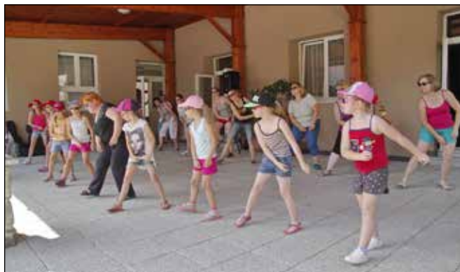
Reméljük, jövőre lesz folytatás!

Az eredményhirdetés és tombolasorsolás előtt Csóka Bella Zsóka búvólte el énekével a közönséget, utána MC Arnie zenélt a bálozóknak, akik hajnalig rophatták a táncot.