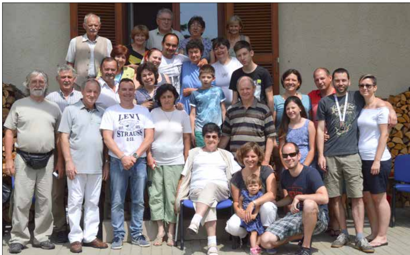
A Jenei és Vass család