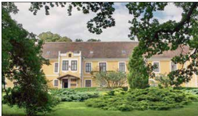
A barokk stílusban épült Felsőbüki Nagy-kastély

„Sitkey György tudván, látván maga fogyatkozott állapotját, maga táplálására, pörlekedéseire, jószága oltalmazására meg kezeléseire és kiváltására való elégtelenségét” úgy döntött, hogy birtokait életfogytig tartó ellátás fejében átadja Galántai Esterházy Mihálynak, Darabos Lászlónak és Máriának. Erre a döntésre 1664-ben jutott, ennek, valamint az azóta eltelt háromszötvenhárom évnek, a töröknek, a németnek és az oroszoknak eredményeképp György késői leszármazottja kerékpáron érkezett a kastélyhoz, ahol nem várta megvetett ágy és nyársra húzott tinó, ettől teljesen függetlenül dobbant meg a szíve a kastély láttán. A – ma a Kovács család birtokában levő, gyönyörű szépen felújított, többször átépített – kastély egyike azon épületeknek, ahol egy pillanatra megáll az idő.