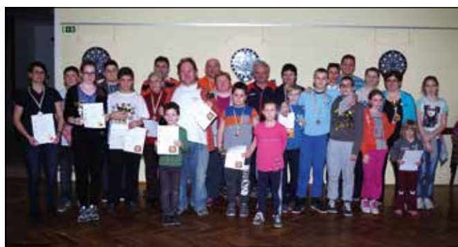
Eredményhirdetés után a verseny résztvevői