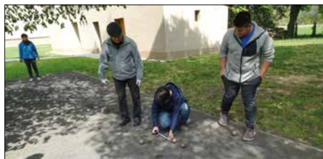
Van úgy, hogy nem lehet szemmértékkel eldönteni, melyik golyó van közelebb az öcsihez, ekkor előkerül a mérőszalag