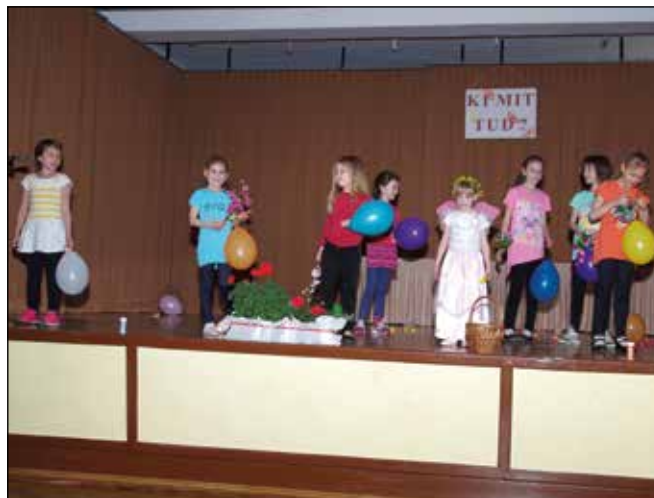
A gyerekek táncukkal igazi tavaszt varázsoltak a Ki mit tud?-on

A kiállítással egyidőben kerültek bemutatásra az Arany János születésének 200. évfordulója alkalmából meghirdetésre került gyermekrajzversenyre beérkezett alkotások is.