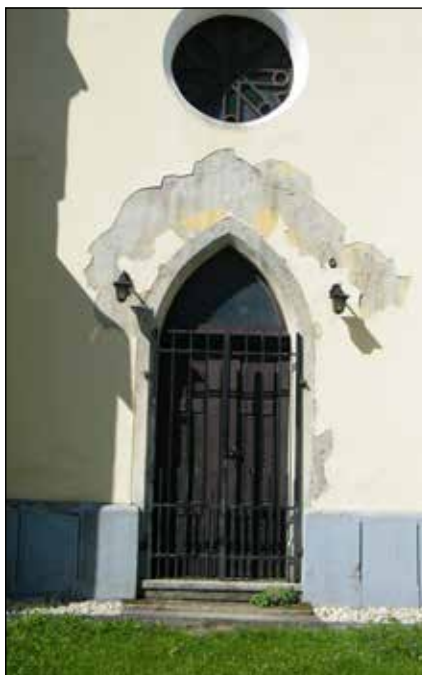
A közgyűlés egyetértett az elnökségnek a kápolna felújítására vonatkozó javaslatával

A katolikus templom padjainak fűtéssel történő felszerelését egyesületünk fizette. Készítettünk egy hirdetőtáblát a kápolna előtti pihenőpadok mellé, mely a faluról és a kápolnáról ad tájékoztatást.