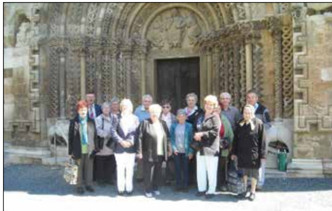
A Nyugdíjas Klub tagjai a jáki templom előtt

Az Álomút című verseskötet megismerése után talán nem túlzás jelen tudósításban sem Álomútként jelölni a jáki kirán-