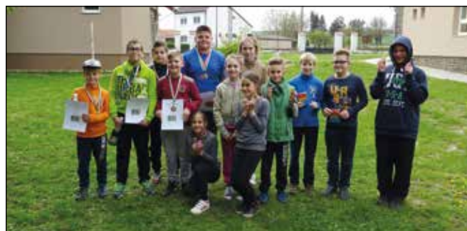
A csocsó verseny résztvevői

Amíg a művelődési ház udvarán a felnőttek a petanque pályán mérték össze ügyességüket, addig a gyerekek a csocsóasztaloknál. A 14 gyermek 7 csapatot alkotva mérkőzött meg a bajnokság helyezéseiért. Nagyon izgalmas mérkőzéseket is láthattunk, a gyerekek már profi módon forgatták a fém ru-