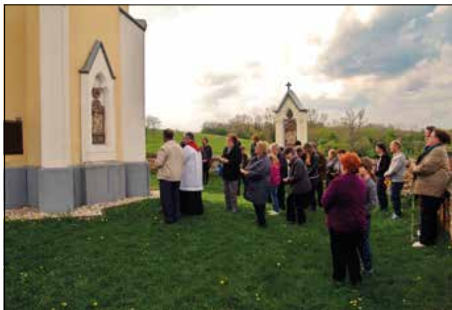
A nagypénteki keresztút községünkben a kápolnánál van megtartva

Tudom, hogy a szentmise sokszor egyszerűnek tűnik és néha még unalmas is lehet. Bár papként sokszor álltam testi-lelki fájdalommal az oltárnál, de mégsem mondhatom el, hogy egyszer is unalmas lett volna a szentmise. A kenyeret és a bort is lehet mindennap fogyasztani, mégis megunhatatlanok. Vidéken, sok falu mellett nehéz mindenhol, mindent szépen megünnepelni a szentmisében, de azért itt-ott vannak ünnepélyesebb pillanatai a keresztény életünknek. A szent háromnap ebben a csúcspontban, a keresztény életünk legünnepélyesebb pillanatai egész évben. Nem akarok annyi hittanos dolgot most itt leírni, csak pár, keresztény „életre való” gondolatot.