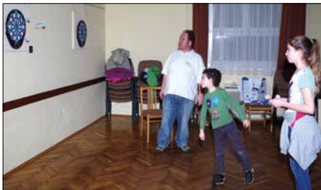
A darts versenyen több generáció is képviseltette magát

Napjainkban a darts óriási léptékben terjed, s hódít teret magának. Ezért merült fel az a gondolat bennünk, hogy mi lenne, ha közösségünkben is meghirdetésre kerülne az első darts verseny. Az ötlet jónak bizonyult, hisz 19 nevezővel indult a verseny, szintén férfi, női és ifjúsági kategóriában. 301-es játszmaikat játszottak a versenyzők egymással, többször is tanúi lehettünk