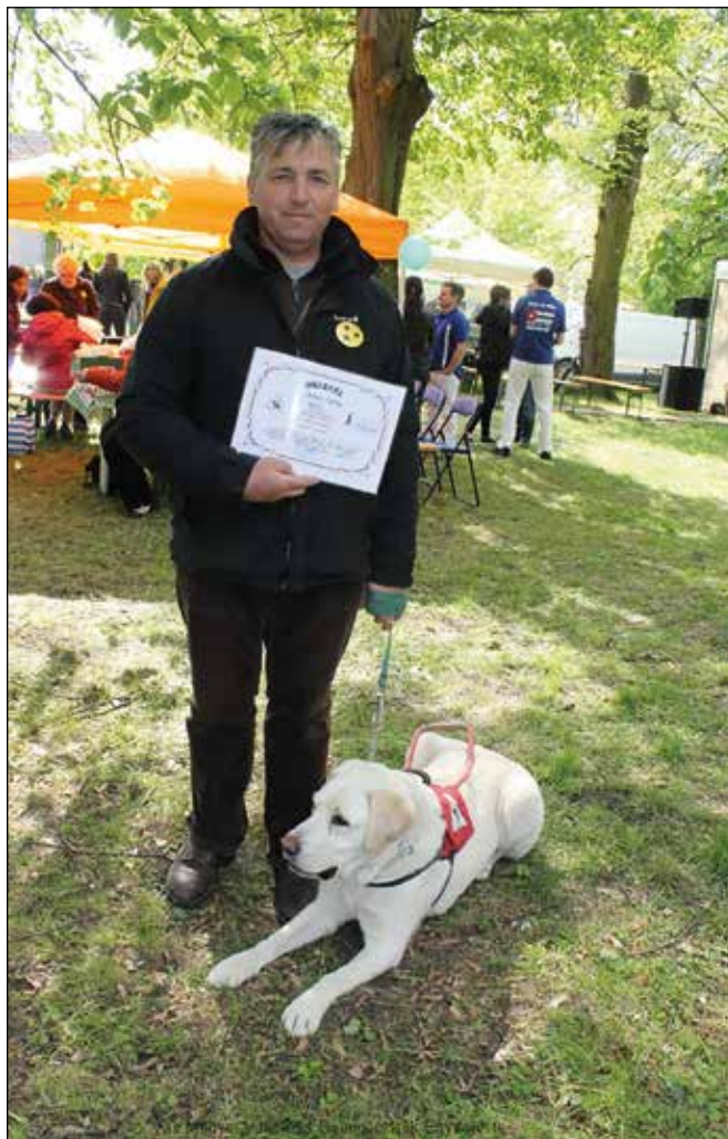
Budapesten az Országos Vakvezető kutyás versenyen, ahol holtversenyben első helyezést értek el

– A közlekedésnél hiányzik a látás, néha kissé bizonytalan vagyok, máskor segítséget kell kérnem látóktól, de a lábam jó. Tavalyelőtt például 22-szer voltam Pesten. Rendszerint Bercivel közlekedek, és a kutyára maximális bizalommal lehet és kell is támaszkodnom. Épp múlt hónapban értünk el holtversenyben egy első helyezést Budapesten az Országos Vakvezető kutyás versenyen. A mozgássérültek szervezetével együttműködésben nagyon sokat dolgozunk mostanában az akadálymentesítés érdekében, melynek részeként a közeljövőben 10 gyalogátkelőhely lesz Szombathelyen többek közt beszelő jelzőlámpával, taktilis jelekkel ellátva. Mindenhol lenne