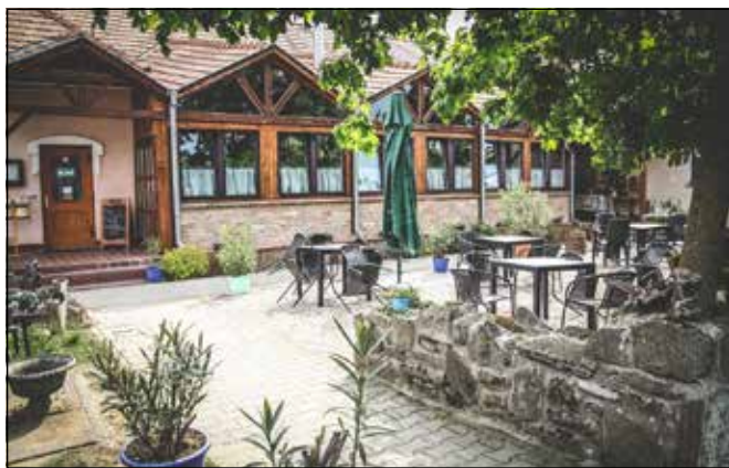
A Borostyánkert Vendéglő 15 éve várja a vendégeket