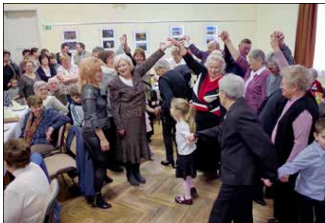
Közös játék az óvodásokkal