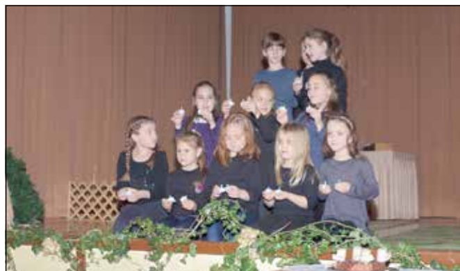
A gyertyás táncot előadó kislányok