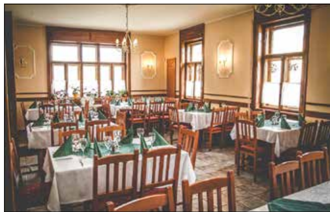
Étterme kiválóan alkalmas családi, baráti találkozók tartására