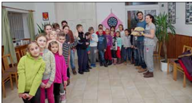
Végre kisült a palacsinta