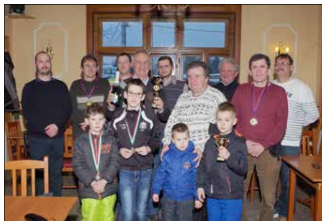
A bajnokság résztvevőinek egy csoportja az eredményhirdetés után