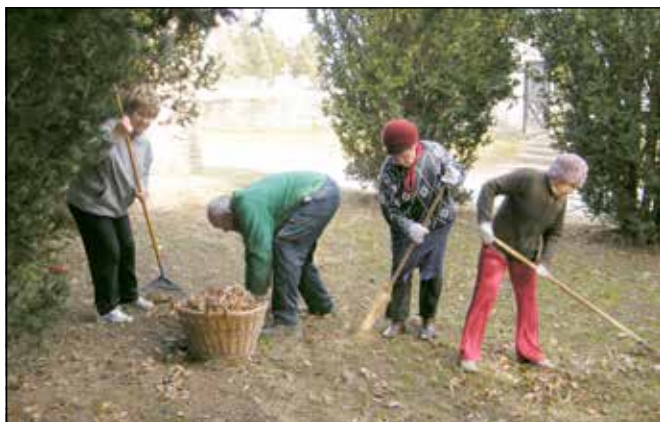
A Nyugdíjas Klub tagjai szorgoskodnak az emlékparkban