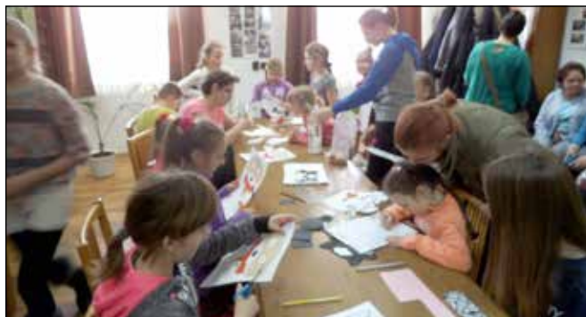
Készültek az álarcok, de már a fánk illata lengte be a termet

Február elején még napokig finom illat, a vaníliacukros fánk illata fogadta a művelődési házba betérőt, a farsangi fánk sütése ugyanis már évek óta hagyománynak számít. Reméljük,