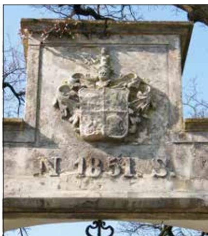
A Felsőbüki Nagy család címere a kastély kapuja felett

Megyei Értéktár bizottsági elnökének felhívására helyi értékeink közül két javaslat került elküldésre azzal a céllal, hogy helyi értékből megyei érték lehessen. Az egyik a Felsőbüki Nagy család épített öröksége címen magába foglalta a templomot, a kápolnát és a kastélyt. Községünk földesurai közül ugyanis kiemelkedő szerepe volt a Felsőbüki Nagy családnak. Nekik köszönhető, hogy az