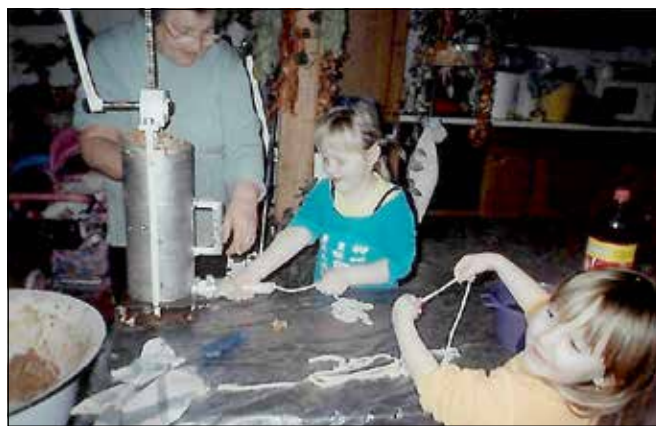
A lányok a kolbásztöltésből sem maradnak ki

Ilyenkor senki sem akart iskolába menni, ahol szinte dupla hosszúságúnak tűntek az órák. Soha nem akart délután egy óra