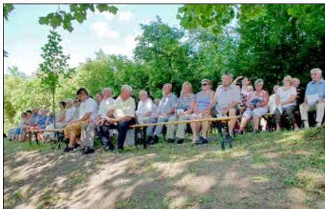
A Kalapos-kútnál rendezett ünnepségen is részt vettek a klubtagok