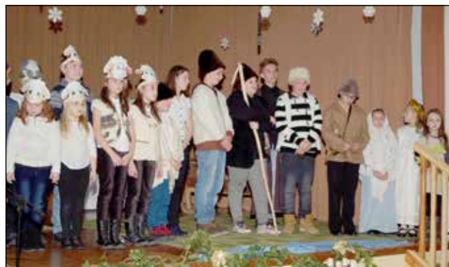
A karácsonyi jelenet résztvevői