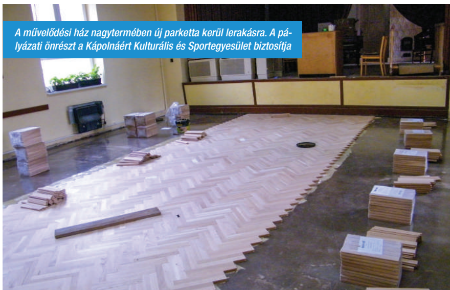
A művelődési ház nagytermében új parketta kerül lerakásra. A pá-lyázati önrészt a Kápolnáért Kulturális és Sportegyesület biztosítja