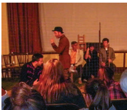
A Soltis Lajos Színház előadása