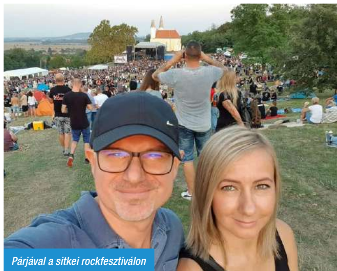
Párjával a sitkei rockfesztiválon

A jegyző helyettesítésével kapcsolatos feladatokon túl kapcsolt munkakörben a hivatal Beruházási és Városfej-