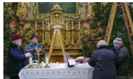
Közben a karácsonyfára is felkerültek a díszek