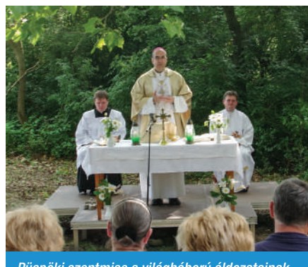
Püspöki szentmise a világháború áldozatainak emlékére a Kalapos-kútnál