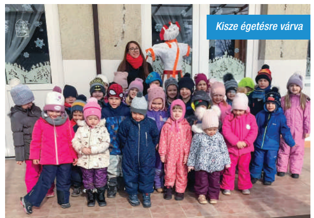
Kisze égetésre várva