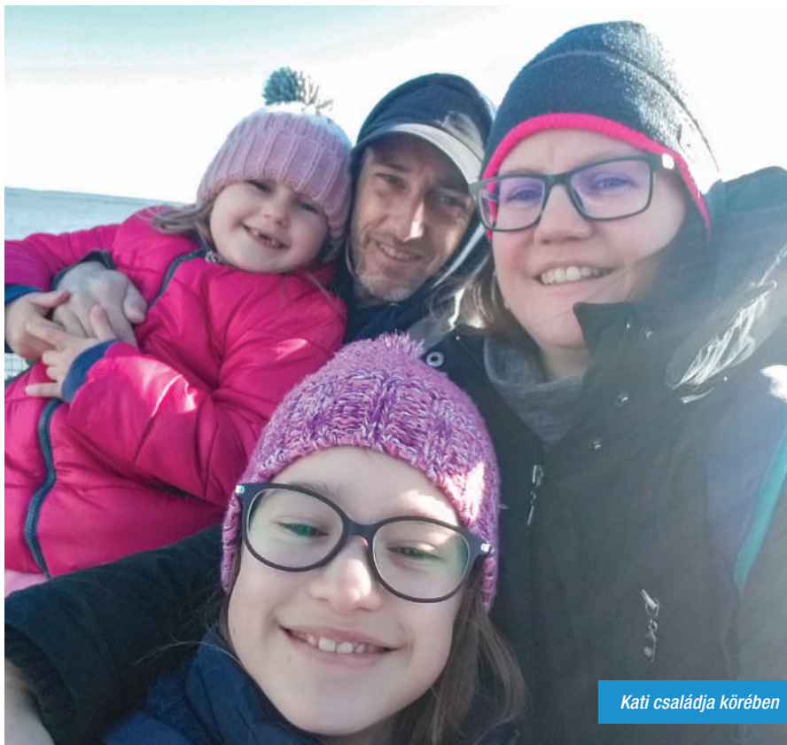
Kati családja körében

Szerencsésnek mondhatom magam, hogy 2015 szeptemberéig otthon lehettem a lányokkal, és 6 év után volt hova visszamennem dolgozni.