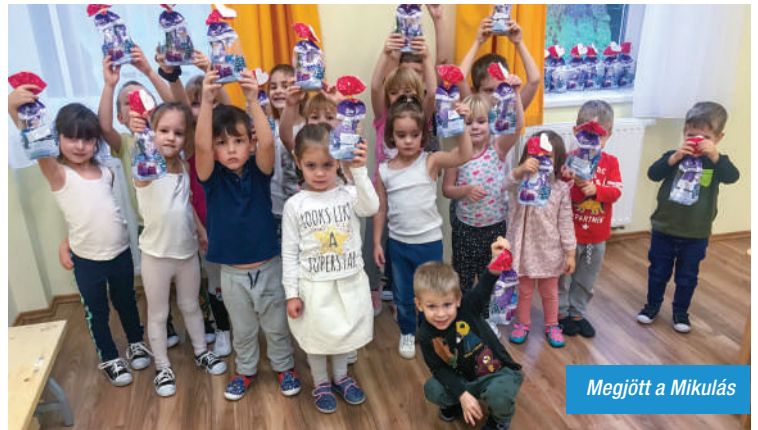
Megjött a Mikulás