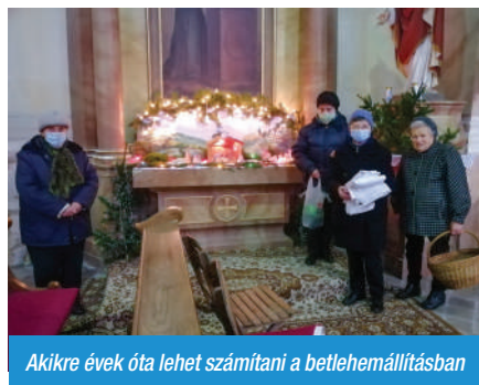
Akikre évek óta lehet számítani a betlehemállításban

Reméljük, a tavalyi évben elmaradt programok nem csak nekünk, de községünk lakóinak is hiányoztak. Különösen decemberben volt üres a művelődési ház, hisz előző években egymást érték a különböző rendezvények. Bár a betlehemet felállítottuk, de az adventi műsor megtartására nem volt lehetőség, sem a falukarácsony megtartására, így karácsonyfát sem kellett állítanunk. A felszabadult időt kihasználva felmentem a templomba megtudakolni, van-e szüksége az ott szorgoskodóknak segítségre a betlehem elkészítésében vagy a karácsonyfa állításában.