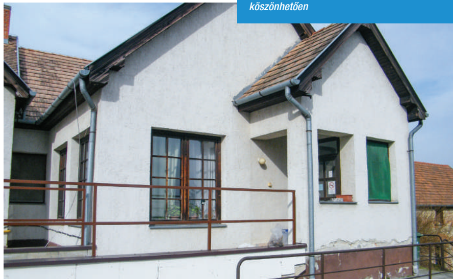
Az önkormányzati konyha épületén szigetelés és ablakszere is megvalósul a projektnek köszönhetően

Megtörtént a területátadás a Hegyalja utca első szakaszát érintő útfelújításhoz, a munkálatok megkezdésének időpontja április körül várható, az időjárástól függően.