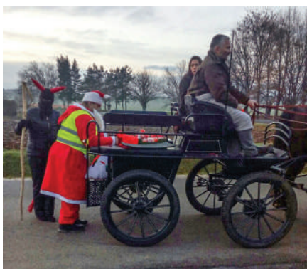
A Mikulás házhoz ment