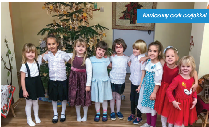
Karácsony csak csajokkal