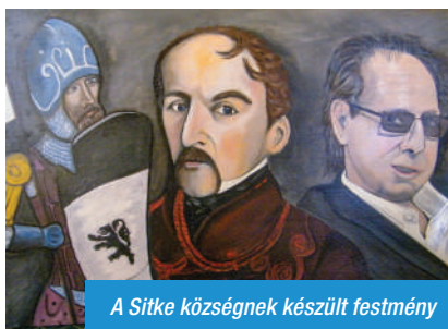
A Sitke községnek készült festmény