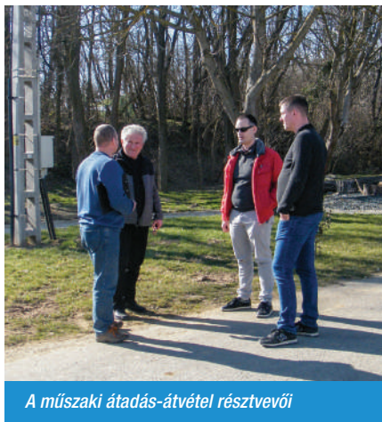
A műszaki átadás-átvétel résztvevői

2021. március 3-án megtörtént a Dózsa György utca felszíni vízelvezetése tárgyú projekt kivitelezési munkáinak műszaki átadás-átvétele.