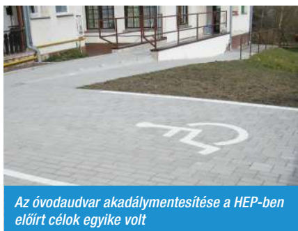
Az óvodaudvar akadálymentesítése a HEP-ben előírt célok egyike volt

Ennek megfelelően a tavalyi év végén ismét módosításra került a Helyi Esély-egyenlőségi Programja a községnek.