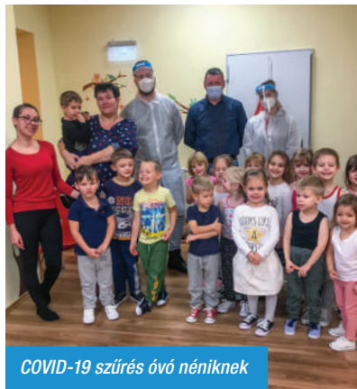
COVID-19 szűrés óvó néniknek