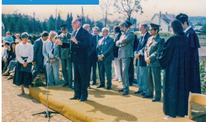
Az emlékpark avatásán 1990-ben