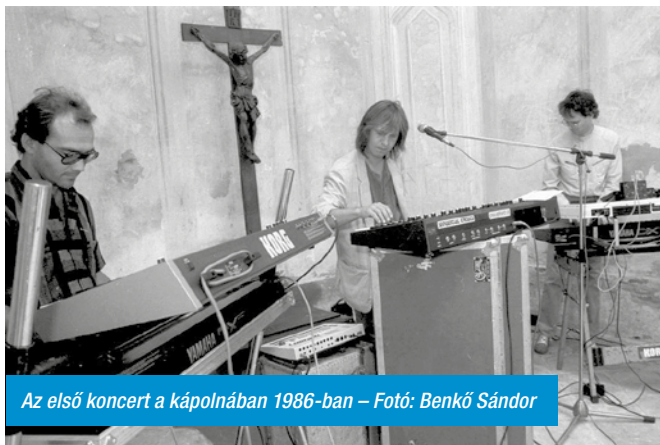
Az első koncert a kápolnában 1986-ban