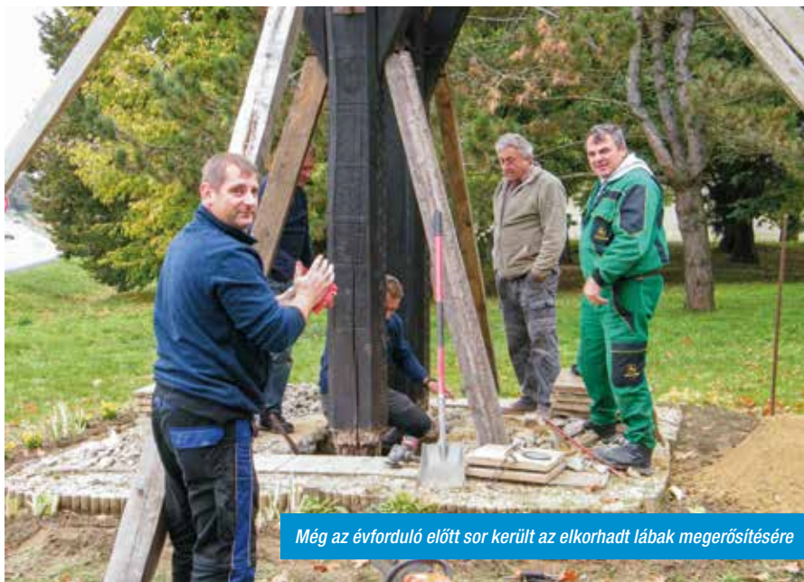
Még az évforduló előtt sor került az elkorhadt lábak megerősítésére