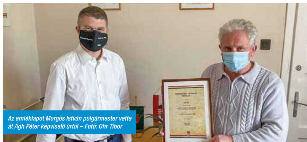
Az emléklapot Morgós István polgármester vette át Ágh Péter képviselő úrtól

Ágh Péter képviselő úr Sitke község lakóinak országgyűlési képviselői emléklapot adott át a 2020. évi tavaszi veszélyhelyzet idején tanúsított fegyelmettségért, összefogásért és az egymás iránt érzett felelősséért.