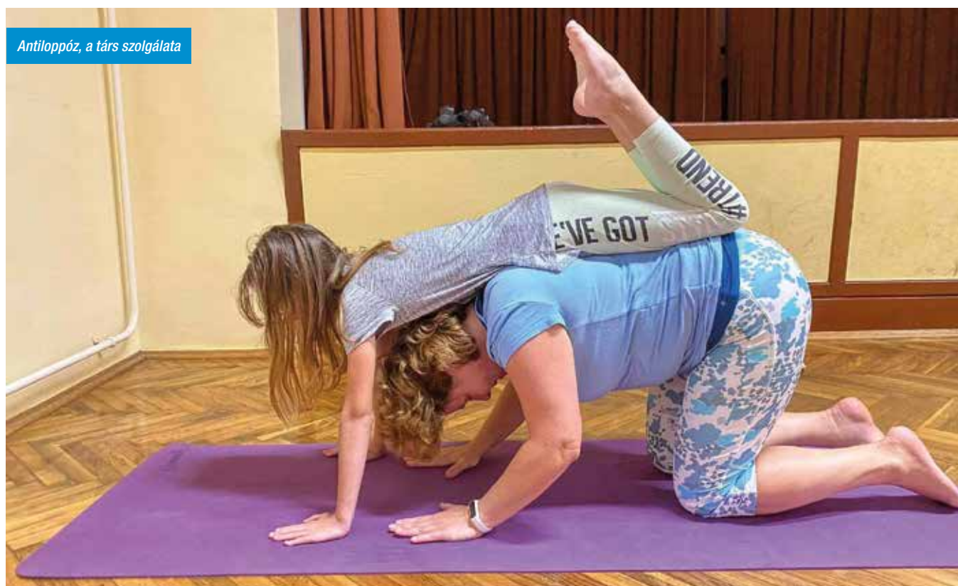
Antiloppóz, a társ szolgálata