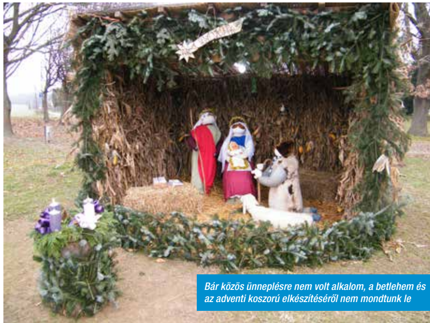
Bár közös ünneplésre nem volt alkalom, a betlehem és az adventi koszorú elkészítéséről nem mondtunk le

Ezért a lap hasábjain keresztül kívánom, hogy mindannyiunkba költözzön szeretet, tegyünk lépéseket a kevésbé szeretett rokonok, ismerősök felé, így találva meg lelkünk békéjét. Ha csak egy kicsit segítünk a másikon, ha félretesszük a haragot, már tettünk lelkünk békéjéért. Ebben a szellemben készüljünk az ünnepnapokra családunkkal, hozzátartozóinkkal, rokonnakkal, jó barátokkal együtt.