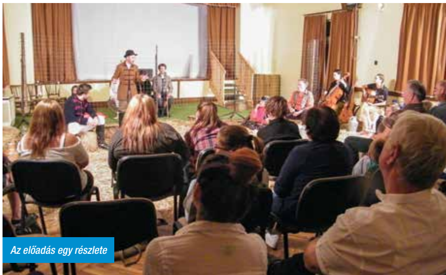
Az előadás egy részlete

A kultúra legyen mindenkié. Ezt a célt tűzte ki maga elé a Déryné Program, melyhez önkormányzatunk is nagy örömmel csatlakozott. A program Országjáró nevű alprogramjának köszönhetően nem csak a több száz főt befogadó művelődési házakba viszik el a minőségi előadásokat, hanem a legkisebb településeket is bevonják, persze ha igény van rá.