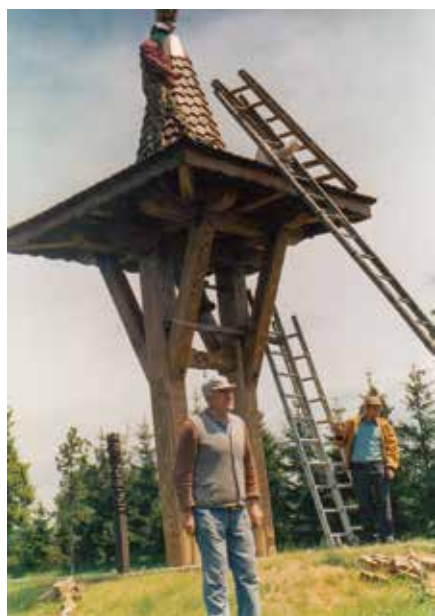
Az utolsó munkálatok az átadás előtt

1984-ben meghalt édesapám. Temetése után fogalmazódott meg bennem a gondolat, milyen jó lenne, ha a temetőben lenne egy harangláb, s annak a harangja szólalna meg, mikor a halottat utolsó