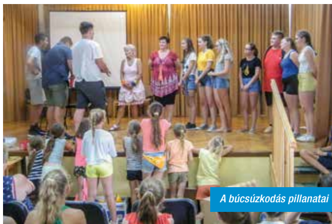
A búcsúzkodás pillanatai

Ezek után egészen különleges érzés volt felkészülnöm erre a táborra. Átnéztem a korábbi táborok anyagait, felöltött bennem ezer emlék, ezer kedves, szeretős érzés.