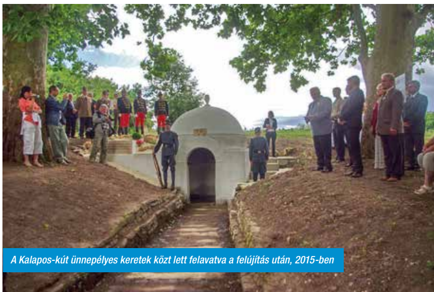
A Kalapos-kút ünnepélyes keretek közt lett felavatva a felújítás után, 2015-ben

Tisztelettel gondolunk a háborúban elhunytakra, felújítottuk három I. világháborús hősi halott sírját, a Kalapos-kutat, ahol azóta is megemlékezést tartottunk minden évben. Nagy örömünkre szolgál, hogy két hagyományörző csoport működését is segíthetjük községünkben, a közel négy