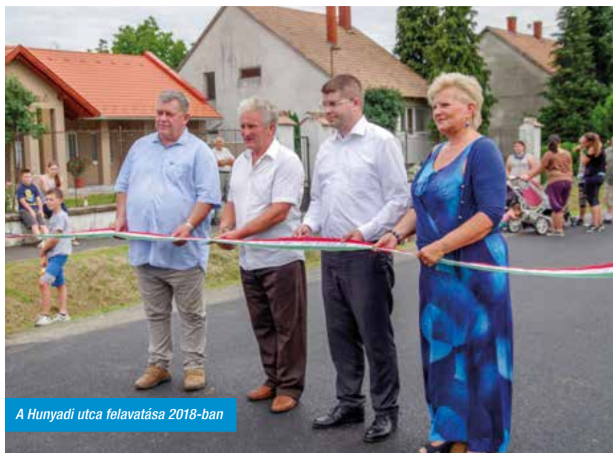
A Hunyadi utca felavatása 2018-ban

A jövő érdekében pedig megragadjunk minden pályázati lehetőséget, hogy községünk lakóit egyre szebb, élhetőbb környezetet vegye körül.