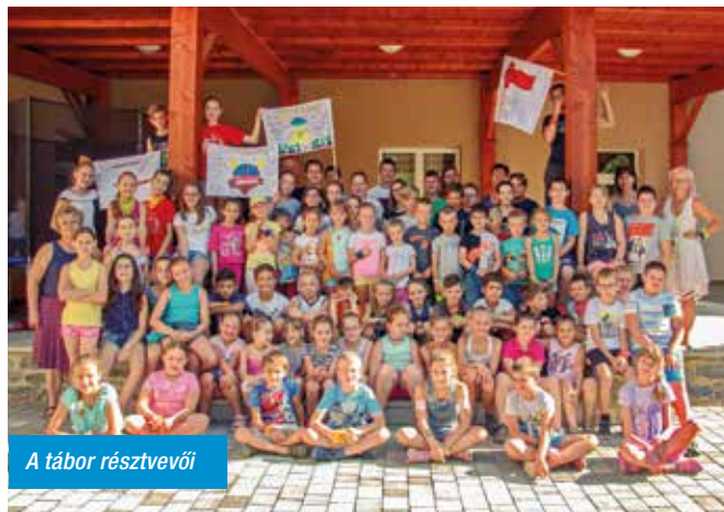
A tábor résztvevői

S persze köszönjük a többi segítő munkáját is, hisz táborunk sikerének egyik fő