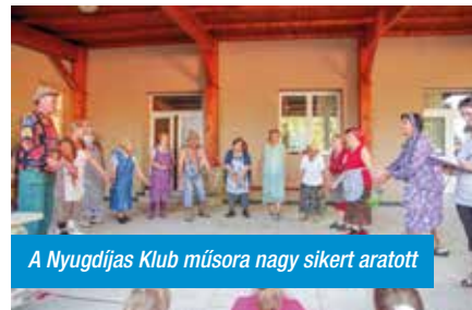
A Nyugdíjas Klub műsora nagy sikert aratott