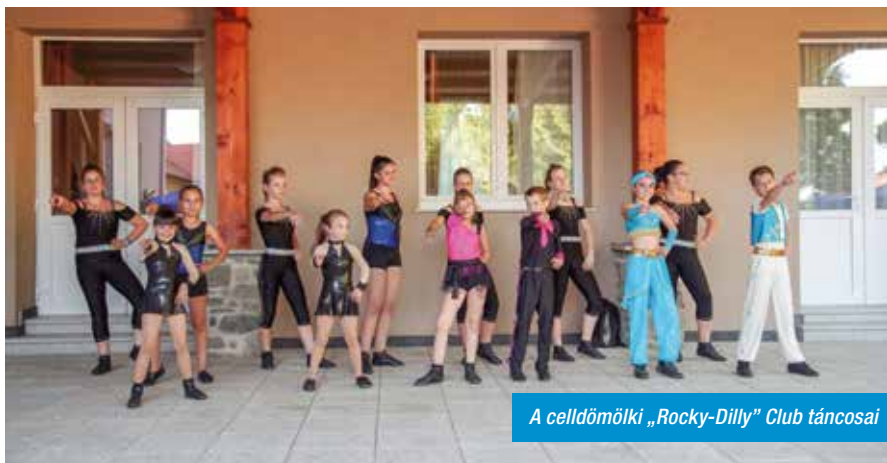
A celldömölki „Rocky-Dilly” Club táncosai