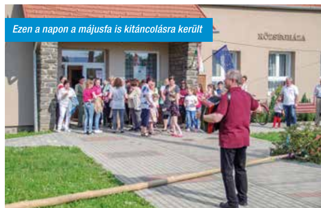
Ezen a napon a májusfa is kitancolásra került

getéssel lépett fel, de egy ének és egy tánc is volt a csapat