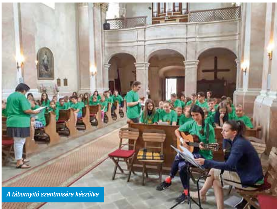
A tábornyitó szentmisére készülve

A sitkei hittantáborban rengeteg fantasztikus élmény várta eddig, és várja a következőkben is azokat a gyermekeket, akik nyáron egy tartalmas hetet akarnak eltölteni barátaik, ismerőseik és természetesen a Jóisten társaságában. Az idei nyáron például Kislődre, a Sobri Jóska Élményparkba látogattak el a tábor lakói, ahol különféle vízi és szárazföldi játékok egyaránt várták őket (légvár, rodeóbika, hófánkcsúszda, vízbicikli, kötélpálya, stb.). Ezenkívül a sárvári Termálfürdőben is egy izgalmas délutánt töltöttek el, majd este pizzázással zárták a napot. A tábor utolsó estéjén minden gyermeknek alkalma nyílt tehetsége megmutatására – akár énekel, táncol, szavalással, vagy éppen tornabemutatóval. A tábor folyamán a csapatok vetélkedőkön is részt vettek, melyben ügyességüket, eszességüket megmutatva az utolsó napig küzdöttek a jobbnál jobb díjakért. A táborba az idei évben a Nemzeti Művelődési Intézet munkatársai is ellátogattak, akik csapatépítő játékokkal ismertették meg a résztvevőkkel Vas megye neve-