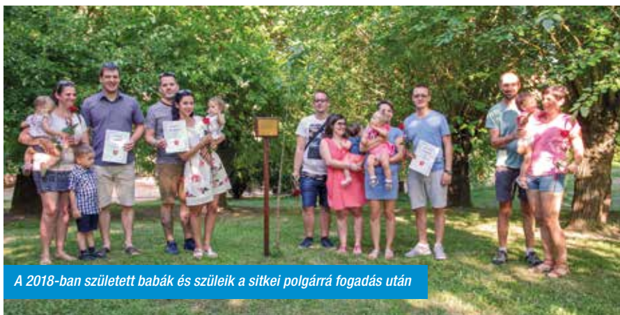
A 2018-ban született babák és szüleik a sitkei polgárrá fogadás után

Szombaton már délelőtt folytatódott a falunap programjai a Kissitke – Nagysitke közötti nagypályás labdarúgó-mérkőzéssel. Tisztelet a fiúknak, hogy a nagy melegben is hősiességet vívtak a győzelemért. A szünetben a 14