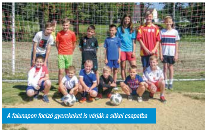
A falunapon focizó gyerekeket is várják a sitkei csapatba

Jelenlegi célunk a tavalyi szereplést felülmúlni, egy összetartó, játékban összehozott csapatot kovácsolni.