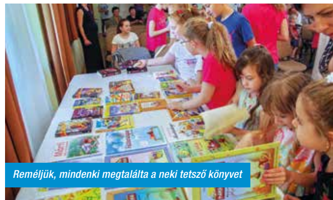
Reméljük, mindenki megtalálta a neki tetsző könyvet

getés várta a résztvevőket. Reméljük, jól érezte min-