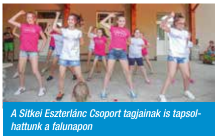
A Sitkei Eszterlanc Csoport tagjainak is tapsolhattunk a falunapon

fokozták a celldömölki „Rocky-Dilly” Club ifjú és még ifjabb táncosai, és Eszterlanc Csoportunk tagjai. S azt hiszem,