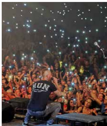
A sitkei csoda

aztán már telt ház előtt adta elő a tőlük megszokott magas színvonalú műsorát, amelyet végigtombolt a közönség. Következett a Kowalsky meg a Vega,