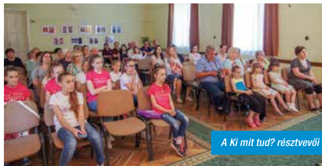
A Ki mit tud? résztvevői

A fotókiállítás megnyitása után versek, dalok, táncok következtek.