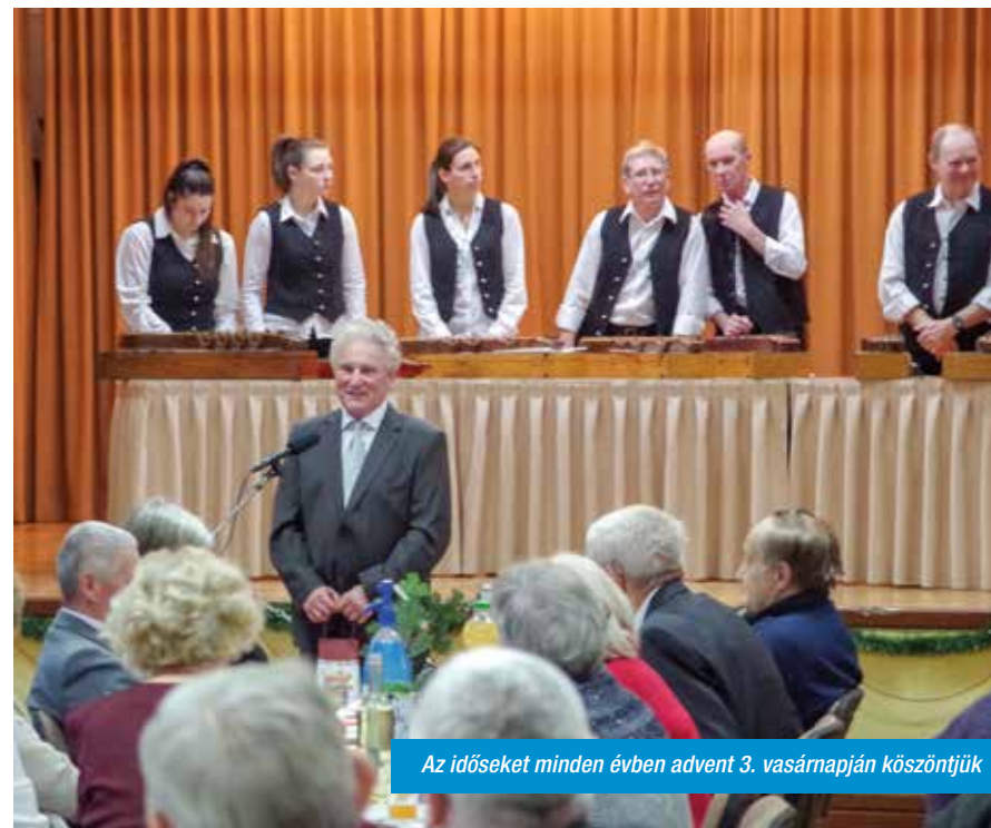
Az időseket minden évben advent 3. vasárnapján köszöntjük

gatással van esélyünk. Nagyon fontos lenne a járdák javításának, a csapadékvíz elvezetésének megoldása, amihez