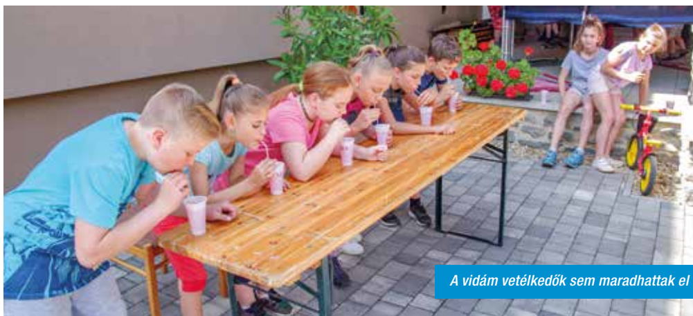
A vidám vetélkedők sem maradhattak el