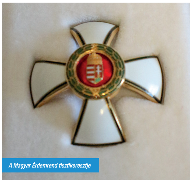
A Magyar Érdemrend tisztikeresztje