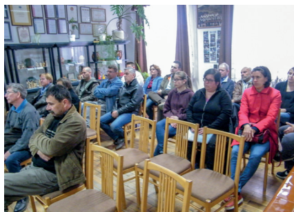
Az egyesület tagsága a beszámolókat hallgatja