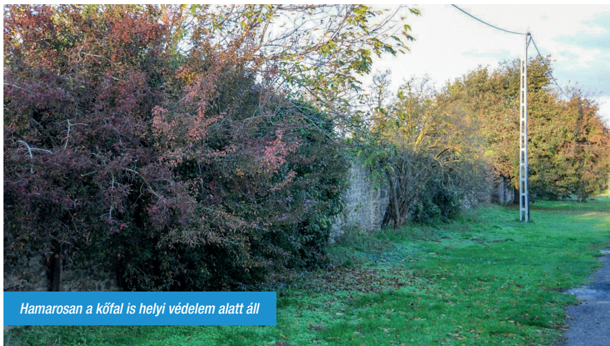
Hamarosan a kőfal is helyi védelem alatt áll