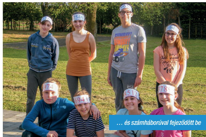
... és számháborúval fejeződött be