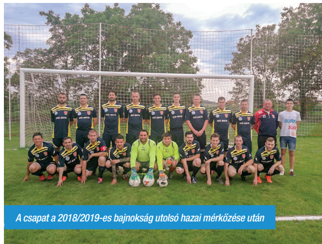
A csapat a 2018/2019-es bajnokság utolsó hazai mérkőzése után

– Amióta itt vagyok, számomra az derült ki, hogy a csapat működéséhez az anyagi források egyértelműen biztosítva vannak. Mind Sitke Község Önkormányzata, mind a Kápolnáiért