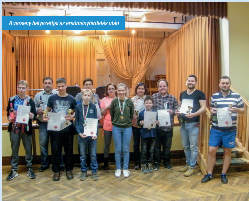
A verseny helyezettjei az eredményhirdetés után

Kilencedik alkalommal rendeztük meg községünkben a „Nostalgia Kupa” asztalitenisz versenyt és harmadik alkalommal hívtuk a dartsot kedvelőket egy kis versenyre. Már az elmúlt években is bebizonyosodott,