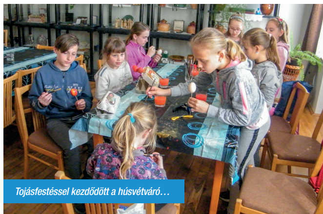
Tojásfestéssel kezdődött a húsvétváró...