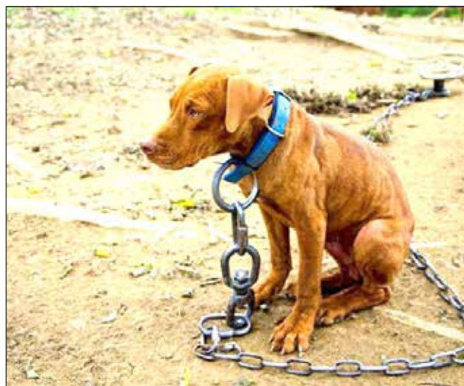
2016. január 1-től TILOS kutyát tartósan kikötve tartani