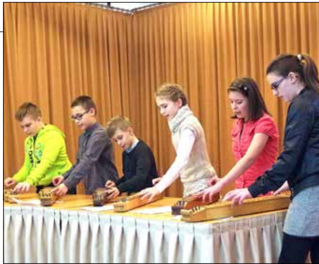
A Sitkei Gyermek Citerazenekar...