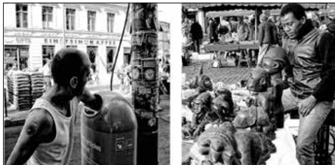
Berlin-Brüsszel, részlet az Europica sorozatból

arra, hogy 400 évvel ezelőtt egy magyar, Szepsi Csombor Márton bejárta Európát és tapasztalataiból útleírást készített