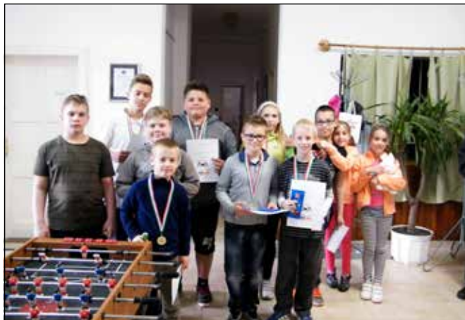
A csocsóverseny résztvevői az eredményhirdetés után