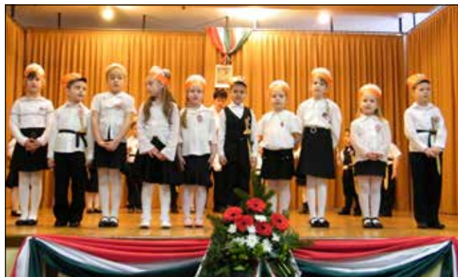
A nagycsoportosok a Nemzeti dalt szavalták