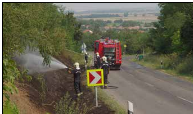
A Köves dombon is feltehetően felelőtlenségéből kapott lángra az aljnövényzet