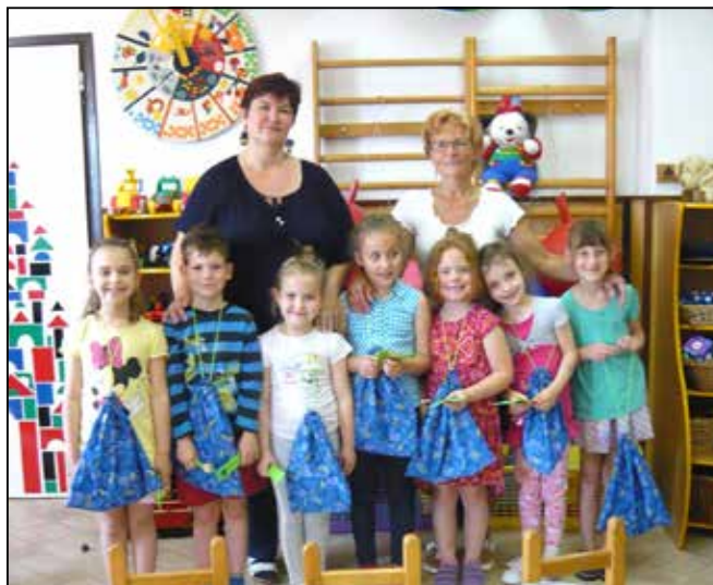
„A csomag tartalma” nevelők körében