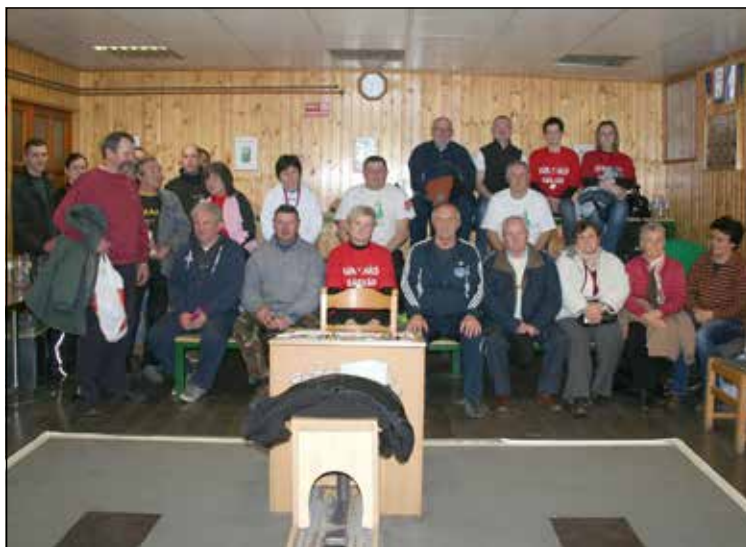
A versenyen résztvevők egy csoportja