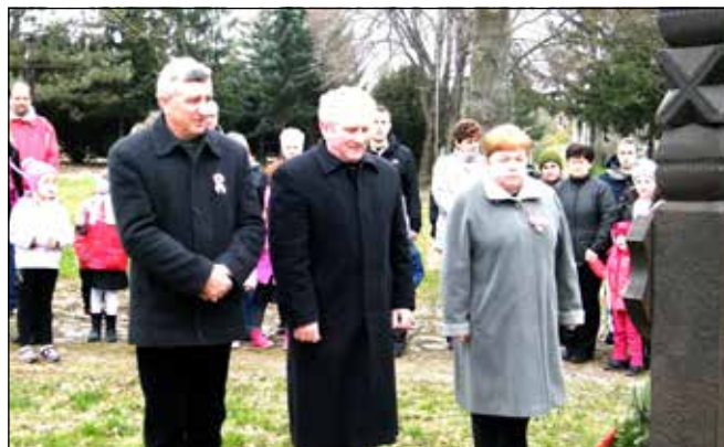
Főhajítás a hősök előtt