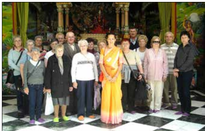
A Nyugdíjas Klub tagjai a Krisna-völgyi templom szentélyében az idegenvezető társaságában

Május 25-én lezajlott a 2016-os év talán legjelentősebb klubeseménye, kirándulásunk Somogyvámosra, a Krisna-völgybe és Niklára, a Berzsényi emlékmúzeumhoz. Hazafelé a Zalasántó és Bazsi közötti út mellett 2001-ben állított emléktáblát is megnéztük, a leírás szerint e domboldalról tekintett vissza Kemenesaljára a szülőfalujából, Egyházashetyéről Niklára költözésekor Berzsényi Dániel.