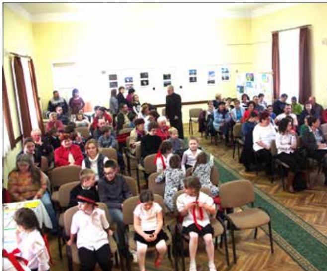
Az eredményhirdetés előtt nagy volt az izgalom