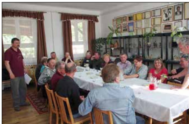
A borosgazdák is együtt kóstolták a borokat a zsűrivel