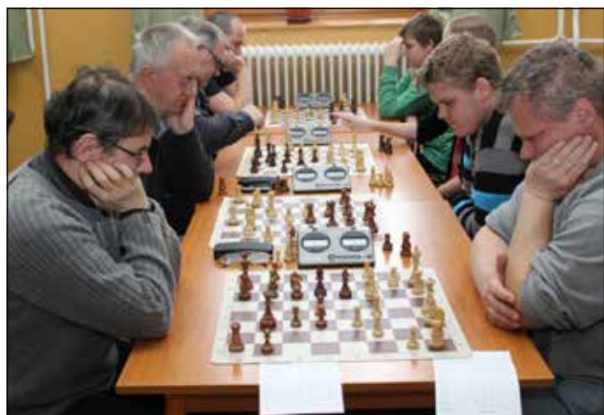
Itt még nem tudhatták, hogy ők lesznek a legjobbak