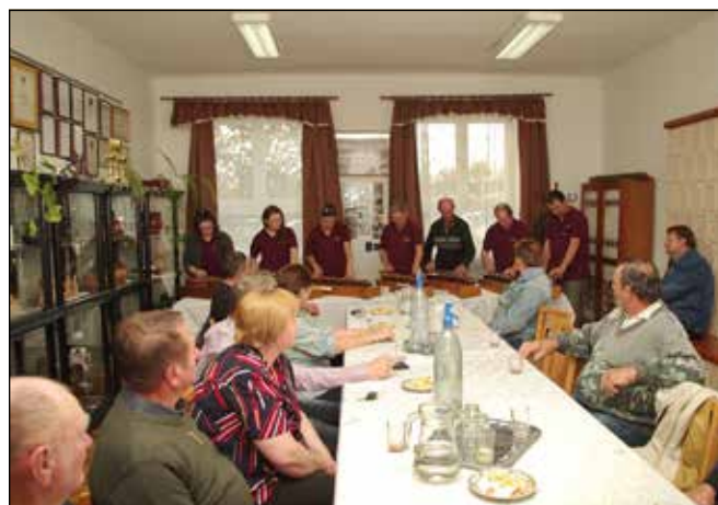
...majd a citerások szórakoztatták őket az eredményhirdetésig

Arany minősítést a következő borok kaptak: