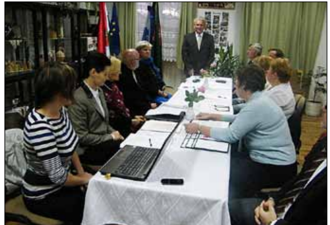
A képviselő-testület alakuló ülésén a Sárvári Közös Önkormányzati Hivatal irodavezetői is részt vettek

Sitke község közterületei teljeskörűségének, pontosságának és valóságtartalmának a felülvizsgálatához a központi címregiszter kialakításához kapcsolódó döntést hozott az önkormányzat. Eszerint a címadatot tartalmazó állami és önkormányzati nyilvántartások együttműködési képességének elősegítésére és az egységes címkezelés biztosítására 2015. január 1-ig létre kell hozni a központi címregisztert. A törvény értelmében a központi címregiszter olyan, a nyilvántartások