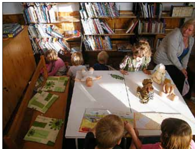
Szerencsére nem sokáig maradtak szépen sorban a könyvek a leválogatás után

Kérem, használják ki a könyvtár nyújtotta lehetőségeket, hisz nem csak könyvkölcsönzéssel állunk a falu lakóinak szolgálatára, de DVD-k, folyóiratok kölcsönzésére, fénymásolásra is van mód. A főiskolások részére pedig szívesen