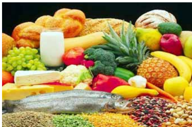
A reform célja, hogy minél több zöldség, gyümölcs, teljes kiőrlésű gabonából készült étel kerüljön az asztalra

A népegészségügyi intézetek a közétkeztetés táplálkozás-egészségügyi követelményeinek rendszeres figyelemmel kíséréssel, oktatással és tanácsadással se-