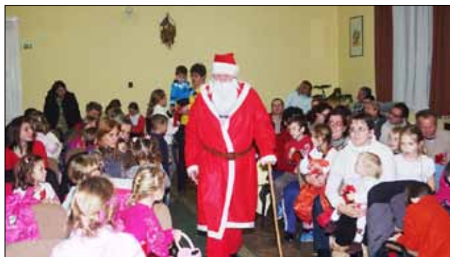
1986 óta minden évben megajándékozza a Mikulás a gyerekeket a művelődési házban, 2001-ig a Sitkei Ifjúsági Kör; 2002-től pedig az önkormányzat jóvoltából

Ezután terjedt el a hír, hogy Télapó minden évben megajándékozza a szegényeket. Egy idő után kitudódott, hogy ki is valójában a Mikulás, ugyanis az aranyak között, amit a legkisebb lány kapott, volt egy olyan darab, amit a helyi aranykereskedő adott