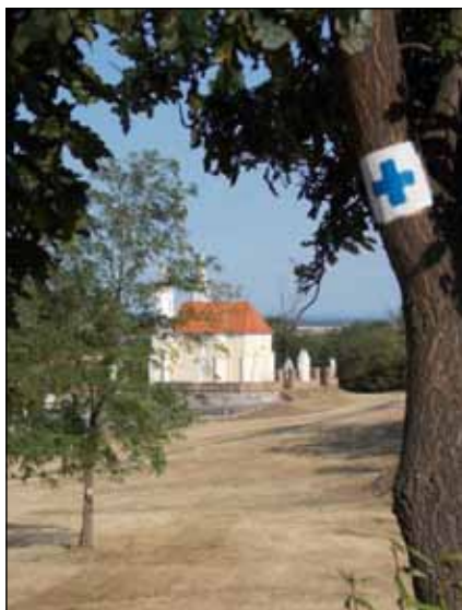
A kék túra jeltől ilyen látvány tárul a túrázó elé

Bizonyára ismerősen hangzik mindenkinek az így kezdődő népdal, és vele együtt a Másfélmillió lépés Magyarországon című sorozat. Az 1980-as évek elején vetített televíziós sorozatban Rockenbauer Pál és csapata az Országos Kéktúra útvonalát mutatta be. A hazánkat átszelő „Kék” turistaút jelenleg az Írott-kőtől a Zempléni-hegységben található Hollóházáig vezet 1118 km hosszsan. Rockenbauer Pál a Dél-Dunántúli Kéktúrával, valamint az Alföldi Kéktúrával egy kört alkot, melyet Országos Kék Körnek is neveznek. A Magyar Természetbarát Szövetség 1961-ben hirdette meg egyénileg is teljesíthető túramozgalomként, akkor még a Sümeg–Nagy-Milic útvonalon. 1977-ben hosszabbították meg a Kőszegi-hegységig, ekkor lett része Sitke is, mely a 27 szakasz közül a másodikhoz (Sárvár–Sümeg 72 km) tartozik. Bár nem pecsételő állomás, mégis fontos helyszíne a Kéktúrának, hisz levezeti a túrázót a Kápolnáig. Sinkó László narrátornak köszönhetően hosszasan időztek Sitkén a sorozat készítői: gyermekkori élményekkel átszőtt nyugodt, takaros faluképet találtak, a környékre jellemző hagyományos