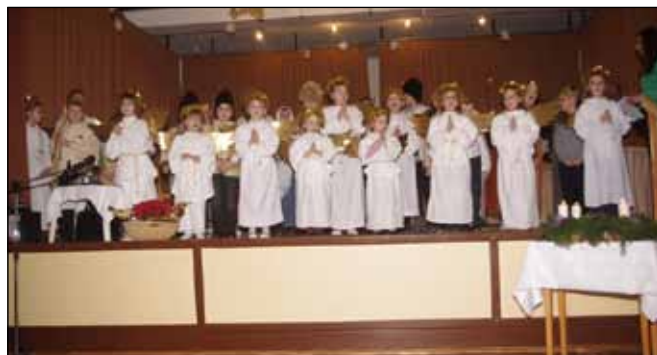
Minden évben együtt ünnepel a falu apraja-nagyja a művelődési házban a szeretet ünnepén

az ajándékok nagysága adná, hanem a szeretet, amiből mindenki részesülhet és amit mindenki adhat. Az ünnep előtti sűrűség-forgásban jusson kellő idő szeretetünkre, közelebbi és távolabbi hozzátartozóinkra, hogy a mulasztásainkat ne csábító ajándékkal akarjuk jóvátenni! Nem az ajándék értéke számít, hanem a szeretet az ember szívében.