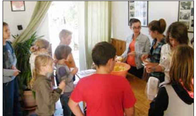
Elkészült a finom gyümölcssaláta

tűzgyújtás volt, a többi programot minden önkormányzat saját hatáskörén belül határozhatta meg. Községünkben ennek keretén belül egyrészt szüreti játszóházba vártuk községünk apraját-nagyját. A gyerekek szőlőt darálhattak, préselhettek, majd a finom musttal szomjukat olthatták. Közben közösségi szolgálatot végző diákok segítségével vidám hangulatban készült a finom gyümölcssaláta, amit szintén közösen fogyaszthattak el. A játszóházat kézműves foglalkozás, játékos vetélkedő, közös sportolás tette még élvezetesebbé. No meg persze a sok finomság, amit a versenyek jutalmául kaptak a gyerekek. A pályázati forrást felhasználva köszöntöttük még községünk jubiláló házaspárjait is. A tűzgyújtás pedig egy kis beszélgetésre adott alkalmat. Akinek kedve volt, az énekelhetett is, hisz Jenei András harmonikaszóval megadta hozzá az alapot.