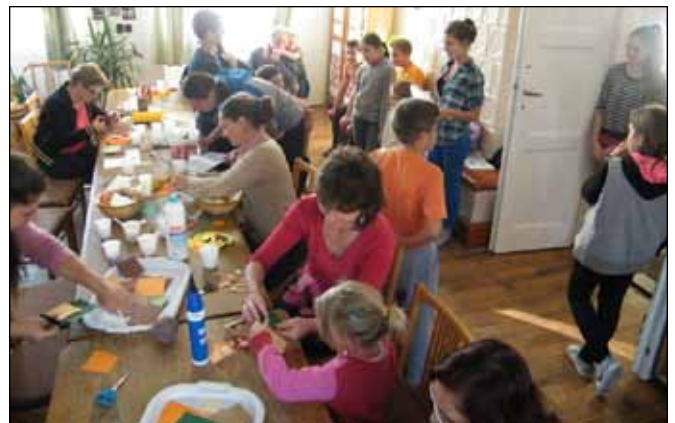
A kézműves foglalkozás is sok gyereket vonzott

Reméljük, hogy azok, akik ezeken a programokon részt vettek, jól érezték magukat, így jó helyre került a pályázaton elnyert összeg.