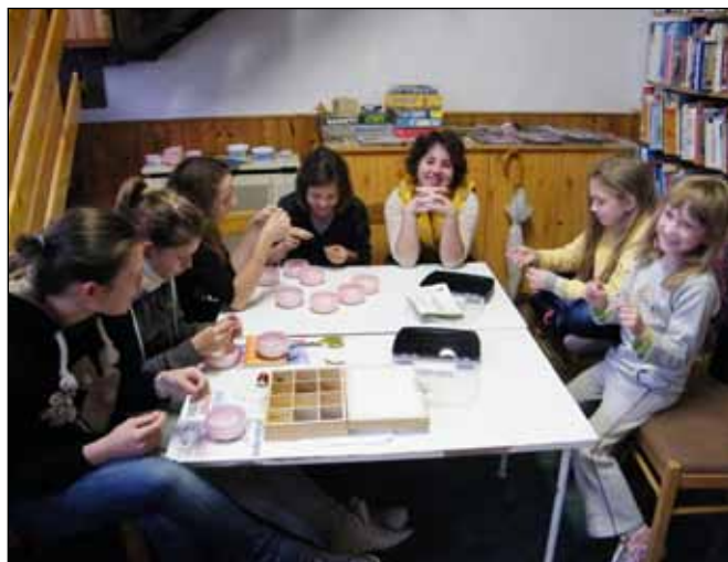
A gyöngyfűző szakkör lelkes tagjai

A Vas Megyei Könyvtárellátási Szolgáltató Rendszer Olvasás és Könyvtár népszerűsítő Programsorozatának támogatásával közszégi könyvtárunkban gyöngyfűző szakkör is működik péntekenként.