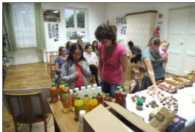
Lehetőség nyílt update ételek, italok kóstolására is

lalkozás-sorozatok keretében pedig az egészséges életmód és táplálkozás témakörben hasznos ismeretekkel gazdagodtak. Az egészségüket óvó és arra figyelmet fordító érdeklődők részt vehettek egészségügyi állapotfelméréseken, ahol reális képet kaptak testi kondíciójukról, illetve az egészségüket veszélyeztető tényezőkről. A sitkeiek aktivizálták magukat a sportversenyeken, a gyalogtúrákon, és mozoghattak az Egész-