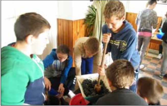
A gyerekek egy részének már csak a szüreti játszóházban van lehetősége szőlőt darálni

Szeptember utolsó hétvégéjén második alkalommal kapcsolódhattunk be az országos „Itthon vagy – Magyarország szeretlek!” programsorozatba. A rendezvényhez 195 000 Ft pályázati forrást biztosított a kormány. A programsorozathoz való csatlakozás egyetlen kötelező eleme a Szent Mihály-napi