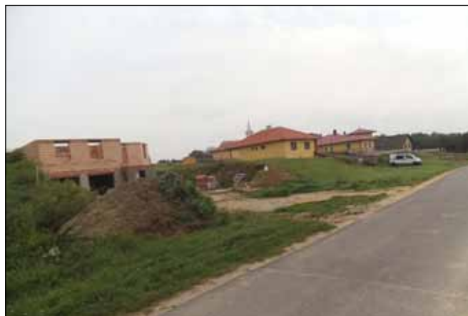
A jövőre nézve bizakodásra ad okot, hogy a Dózsa utcában rövid idő alatt keltek el a telkek

Egy nagyvonalú támogatásnak köszönhetően az önkormányzat tulajdonába került a Kossuth u.13. szám alatti, faluképet erősen romboló ház, melynek helyén parkosítást végzünk.