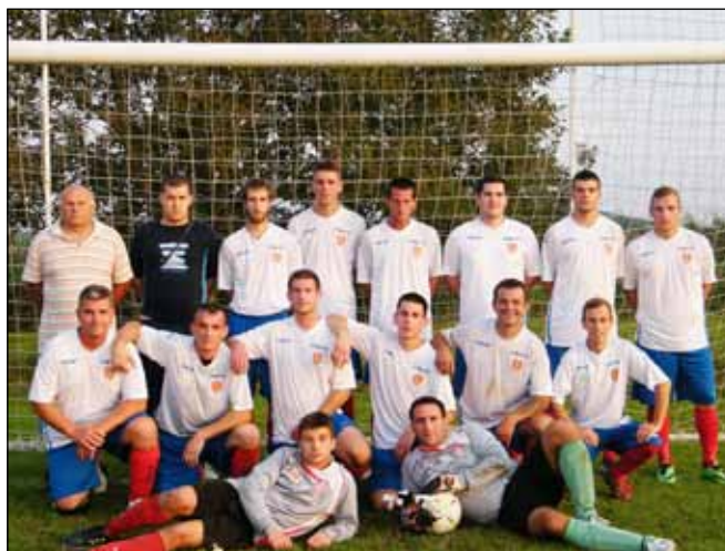
A Csénye ellen 2:0-ra nyert mérkőzés után