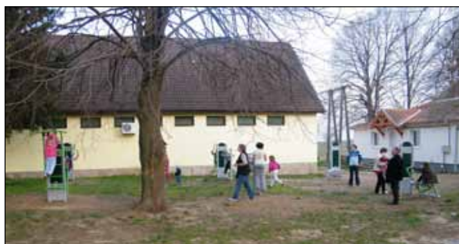
Az elkészült fitness parkot nem csak edzésre használják falunk lakosai, egy kis beszélgetéshez is jó hely

Egy 700 lelkes település költségvetése, akármilyen jól sáfárkodunk vele, kevés ahhoz, hogy nagy beruházásokat, fejlesztéseket végezzünk. Ehhez pályázati forrásokra van szükség, bár ezek kihasználása sem egyszerű. A legtöbb ugyanis előfinanszírozást igényel, vagyis először ki kell fizetni az egész beruházást, s csak ha mindent rendben találnak a pályázat kiírói, akkor juthatunk hónapok múlva a pénzünkhöz. Abban a szerencsés helyzetben voltunk, hogy bátran pályázhattunk, hisz megtakarításaink lehetővé tették az előfinanszírozásokat. Így készült el az utóbbi 4 évben több beruházás is, a ravatalozó, a tűzoltószertár, a futballöltöző felújítása, fűtésének korszerűsítése, a játszótér, amely az idén fitness parkkal is bővült.