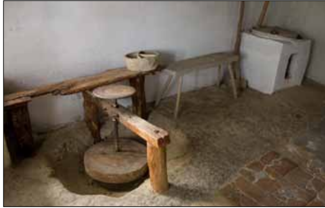
A Gladiatorium után fazekasműhellyel, aszalóval, kézi malommal gazdagodott a Colonia Natura

A Gladiatorium mellett így már a Ceramicum is helyet kapott az Apartman Park területén, s ezzel a múlt igazán megeleveníthetővé vált mindenki számára.