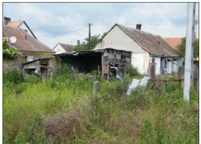
Reméljük, rövid időn belül egy szép pihenőpark áll a faluképet rontó ház helyén