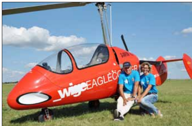
A sitkei páros összesítettben 5. helyezést ért el a világbajnokságon

Ügyességi feladatok között több variáció is szerepelt. A leglátványosabbra az utolsó versenynapon került sor: a kifutó szélességében, egy méter magasságban kifeszítettek egy szalagot, és a pilótáknak úgy kellett megválasztaniuk a felszállási távolságot, hogy a szalagot nem elszakítva a felett el tudjanak repülni. A feladat zárásaként ugyanezen szalag felett leszáll-