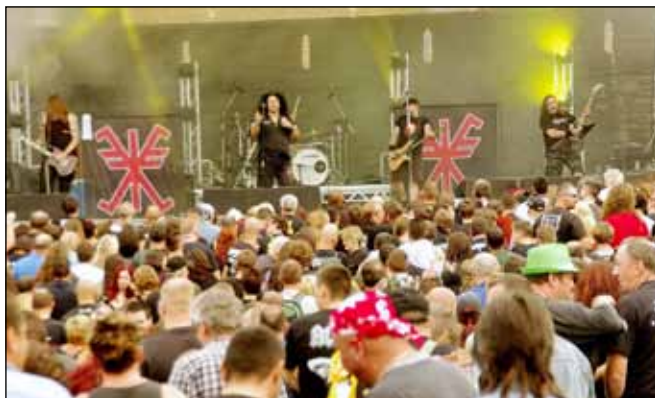
Már a „Kalapács” alatt kezdett megtelni a domboldal

zónsége is, észrevehető volt, hogy a környéken nagyon népszerűek, köszönhetően az évente Csepregen megrendezett táboruknak is. A Lord – nélkülük már nehéz elképzelni a fesztivált – aztán már telt ház előtt adta elő a tőlük megszokott magas színvonalú műsorát, amelyet végigtombolt a közönség. Következett a negyvenéves Edda, akik ebből az alkalomból régi slágereikkel rukkoltak elő rajongóik nagy meglepedésére. Az Ossiannal zárult az este, akiknek fellépésén a fesztiválra látogatók nagy többsége végig kitartott, az utóbbi évekre jellemzően megérkező eső sem zavarta őket.