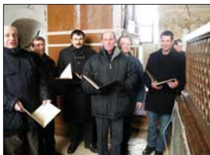
Passió éneklés a templomban

2013-tól a húsvéthétfői borverseny rendezésében is nagy részt vállalnak a tagok. Az egyesület tagjai rendszeres résztvevői a faluban történő rendezvényeknek, társadalmi munkáknak, legyen az favágás, fafűrészelés, szemétszedés, nyári tábor, gyermeknap, rock koncert, idősök napja, falukarácsony, passióéneklés.