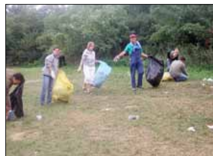
Szemétszedés a kápolnánál

Minden évben szervezünk egy kiwandulást a környék nevezetességei-