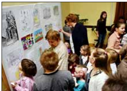
Közönség a mesemondó délutánon

A délután igazi célja, hogy a sitkei gyermekek, akik különböző intézményekbe járnak, ezt a pár órát együtt tölthetik, megismerhetik egymást egy kellemes program keretében. Huszonkettő gyermek készült fel a mesemondásra, kicsik és nagyobbacsák, iskolások és óvodások. Németh Jú-