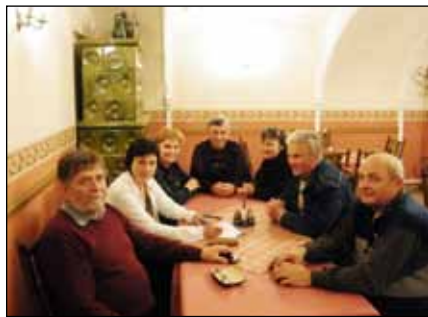
Az új elnökség

Elkészült a stációfülkék restaurálása, valamint a belső festés javítása. Az egyesület stabil anyagi helyzetének köszönhetően támogatta és továbbra is támogatni fogja a községi rendezvényeket, és más civil szervezeteket, csoportokat, valamint a labdarúgó- és tekecsakosztályokat.