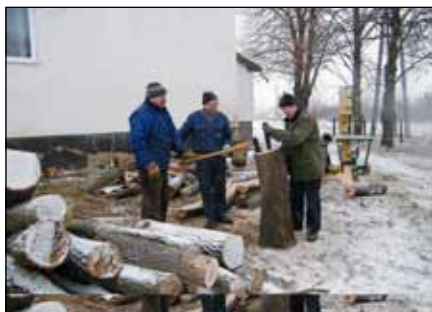
Favágás a művelődési háznál

Ezek dalos találkozók, fesztiválok, falunapok, népzenei versenyek, szüreti felvonulások, idősök napi rendezvények voltak.