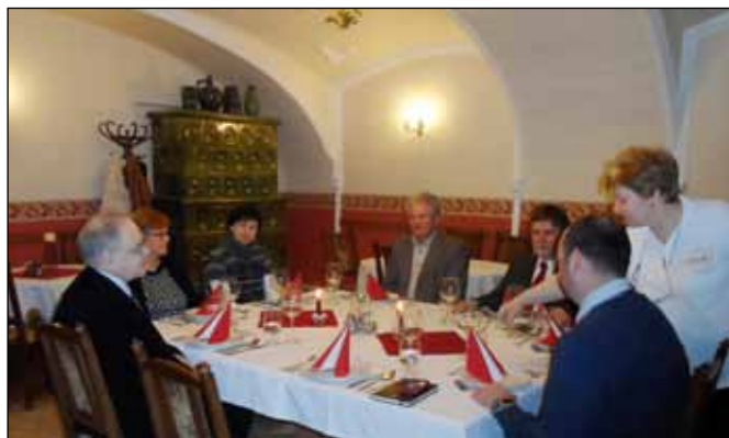
Prof. dr. Schöpflin György európai parlamenti képviselő látogatása Sitkén

ményeiről, az elkövetkező időszak feladatairól. Az elnökség nevében köszönetet mondott azért, hogy az európai parlamenti képviselő folyamatos támogatást nyújt az egyesületnek.