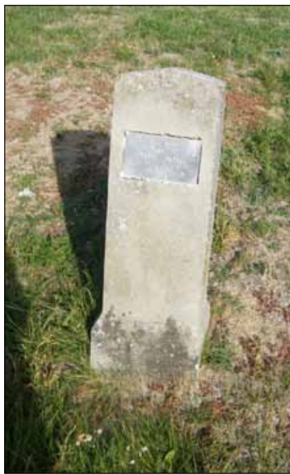
1. világháborús síremlék a régi temetőben

jött létre az antant. (Entente cordiale, azaz Szívélyes Együttműködés Szervezete 1904-ben a francia-angol szerződés megszületésével jött létre). A késlekedést Anglia és Franciaország összefogásában az évszázados rivalizálás okozta, hiszen Franciaország