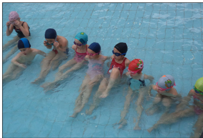
A kilenc mindenre elszánt ovis az uszodában