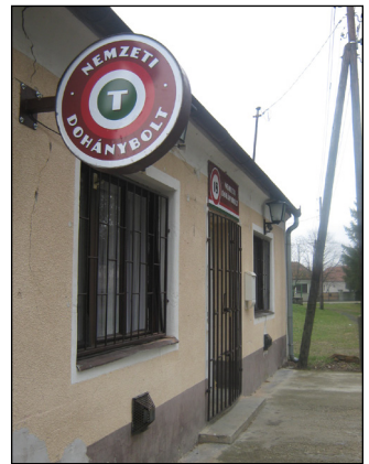
Új funkcióit kapott a „Patkó” kocsmá

Az önkormányzati tulajdonban lévő épületben már sokan próbáltak vállalkozást üzemeltetni, ám az utóbbi időben senkinek sem sikerült hosszú távon érvényesülnie. Bízunk benne, hogy most az ellenkezője valósul meg!