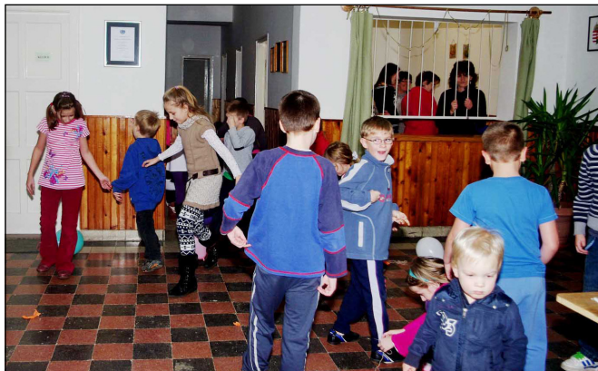
A karácsonyi műsorban szereplő gyerekek palacsintás buliban vehettek részt a téli szünetben