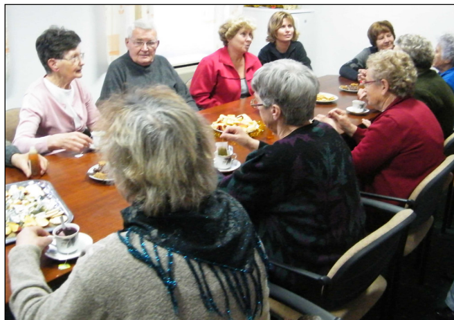
Az előadásorozatban a gyógynövények jótékony hatásaival is megismerkedhettek az érdeklődők

A csoportban elsősorban nyugdíjasokkal találkozhattam, bár néhány fiatal is eljött a beszélgetéseinkre. El kell mondanom, hogy mikor ismeretlen helyre megyek, új emberekkel találkozom, kicsit tartok a közösség hozzáállásától, de gondolom ezzel mások is így lehetnek. Előfordulhat, hogy néhányan kötelezőnek és így mihamarabb letudható, felesleges időtöltésnek tartják ezeket a találkozókat. Nos, ebben az esetben nem volt ilyen problémám. Szenzációs egyéniségekkel, valódi közösséggel, rendkívül nyitott, érdeklődő, kedves emberekkel találkoztam. Öröm volt közöttük lenni. Remélem, minél több sikeres pályázata