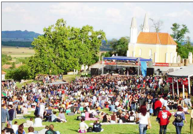
A Kápolna és a rock fesztivál biztosan bekerül a helyi értéktárba