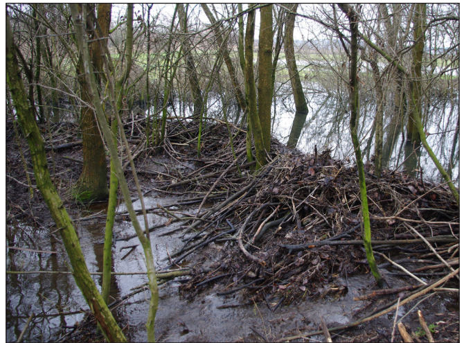
Hódvár a Battyány majornál

egy nemzetközi hód-visszatelepítési program keretében a WWF (Világ Vadvédelmi Alap) aktivistái 234 hódot engedtek szabadon Gemencen, a Hanságban, a Mátrában, a Dráván és a Tisza mentén. Jelenleg a Magyarországon élő hódok száma meghaladhatja a 600-at. Évről évre több bejelentés érkezik a Rába mentéről is hódra utaló nyomok megfigyeléséről.