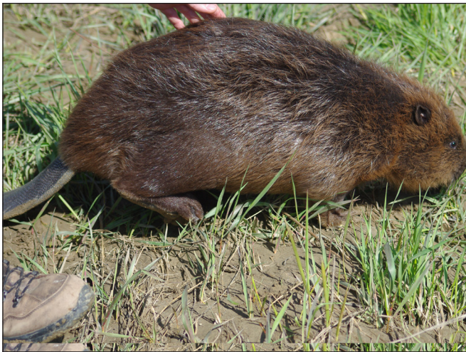
A hód védett állat, természetvédelmi értéke 50 000 Ft

A hód monogám állat, párválasztása egy életre szól. A nőstény állat általában egy-két kölyköt hoz világra kora nyáron, melyek két évig a családban maradnak, utána elvándorolnak új élőhelyet keresni. A hód növényevő rágcsáló. A nyári hónapokban elsősorban lágy szárú növényeket fogyaszt, télen főként puhafák kérgét, fiatal hajtásait, rügyeit kedveli. Táplálékát a víz menti 10-15 mé-