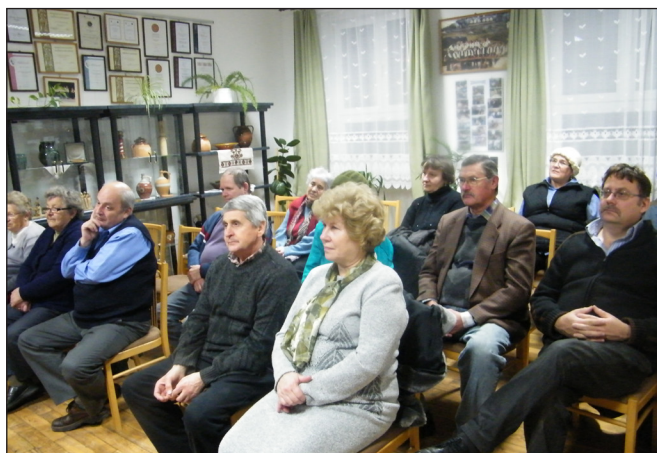
A közmeghallgatáson megjelentek

zött elkülönített keret, valamint a költségvetési törvényben az adóssághoz tartozó konszolidációban nem érintett önkormányzatok fejlesztéséhez nyújtott támogatás biztosíthat forrást. 2014. évre is sok-sok programmal készülnek a sitkeiek számára: a már hagyományosnak mondható mesemondó délutánnal, operett gálával, petanque versennyel és adventi programokkal.