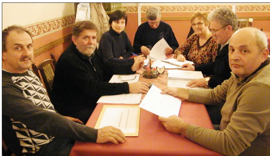
Az egyesület elnöksége a Kápolna támfalának felújítására beadott árajánlatok bontása közben

– Az elnökség létrehoz egy jelölő bizottságot, ennek a feladata lesz a személyi javaslatok begyűjtése. Előzetesen levélben kérjük fel az egyesület tagjait jelölésük megtételére. Valamennyi tag javaslatot tehet az elnök, az ügyvezető elnökhelyettes, a titkár, a pénzügyi vezető, valamint további három elnökségi tag személyére. Kérem, hogy alaposan gondolják végig, s olyan személyeket jelöljenek az egyes funkciókra, akik aktívan, nagy odaadás-