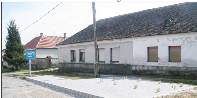
A József A. utcai új buszváró talapzatának megemelésével az idősek és gyerekek könnyebb le- és felszállására is gondolt az önkormányzat vezetősége

S mire lapunk olvasói kézhez kapják a márciusi számot, remélhetőleg elkészül a fitness park is a művelődési ház udvarán a játszótér mellett, s a jó idő beköszöntével mindenki élvezheti a szabadtéri tréningezés örömét.