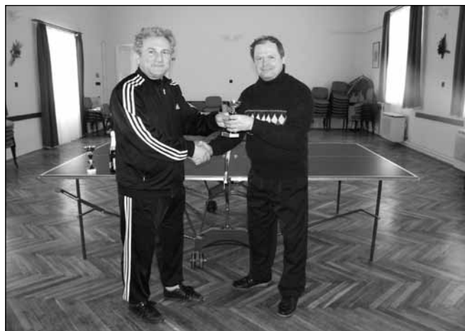
Nostalgia Kupa asztaliteniszverseny díjátadása