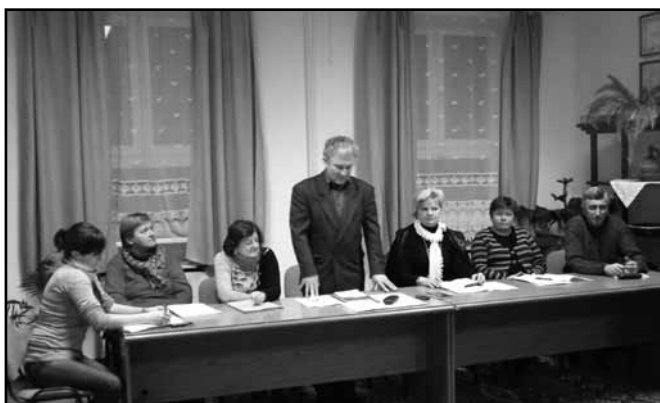
Csak összefogással van esély a falu továbbfejlesztésére

– Én mindig azt mondom, a mi életünket olyan nagyban a változás nem érinti. Az ügyfélfogadási idő is ugyanúgy marad, mint eddig. Járási ügygondnokot sem kértünk, mert nekünk ez nem volt létkérdés.