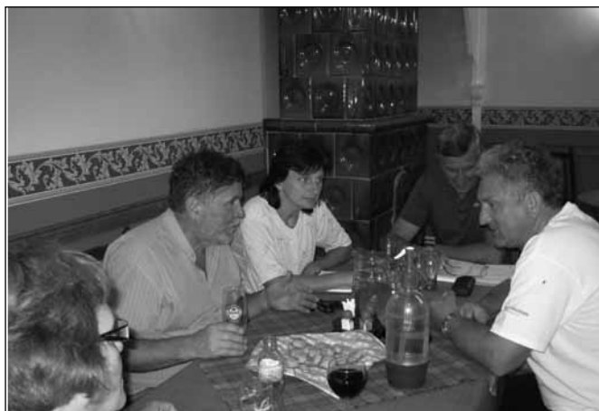
Ülésezik az elnökség

A délutáni fellépők még nem ismertek, több együttes-sel is folyamatban vannak a tárgyalások.