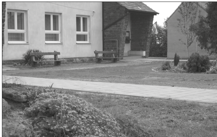
Az önkormányzat járási ügygondnokot nem kért, de a hivatalban ezután is eligazítást kapnak az ügyfelek

Feladatok kerültek át az önkormányzattól a járási hivatalba, de ez a sitkeieket annyira nem fogja érinteni. Most is azt a véleményt osztom, hogy amikor megalakultak az önkormányzatok