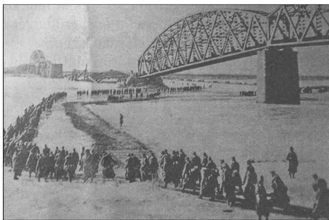
Visszavonulás a befagyott Dnyeperen át

Erre reagálva a szovjet hadvezetés már 1942 végén több támadó hadműveletet készített elő. Ezek közül a Voronyezsi Front osztrogozszk-rosszosi offenzívája a 2. magyar hadsereg megsemmisítését tűzte ki célul. A szovjet támadást 1943.