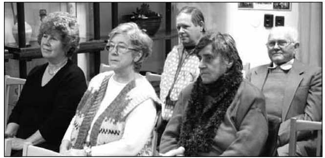
A lakosság közmeghalgatáson kapott tájékoztatást a 2012. évi feladatok teljesítéséről és a 2013. évi célkitűzésekről

összeg tartalmazza a zsák árát is 343 Ft + ÁFA/ürítés. A szelektív hulladékgyűjtés (háztól, zsákos) díjmentes, elszállítása havonta 1 alkalommal történik. A februári ülésen döntött a képviselő-testület, hogy Sárvár város Képviselő-testületével, valamint Porpác község Képviselő-testületével közösen Sárvári Közös Önkormányzati Hivatal néven közös hivatalt hoz létre. A Közös Hivatal szervezeti felépítése a következőképp alakul március 1-től: Hatósági Iroda; Humánpolitikai Iroda; Gazdasági és Városfejlesztési Iroda, azon belül a Gazdasági vezető – Gazdasági Csoport és a Városfejlesztési Csoport; Belső ellenőr, valamint Turisztikai, idegenforgalmi referens. Az ügyfelfogadási rendben változás nem történik. Januári ülésen került elfogadásra az önkormányzat rendezvényterve, ami idén is sok színes, érdekes programmal vár minden kedves érdeklődőt.