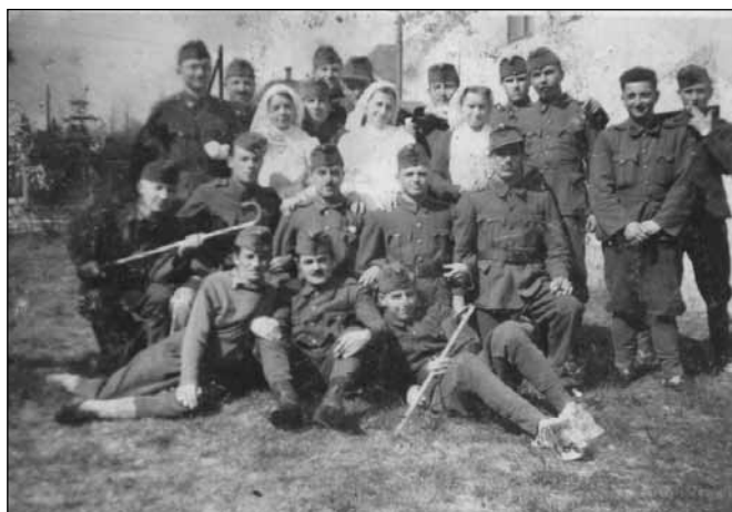
A 2. magyar hadsereg katonái abban a tudatban mentek a frontra, hogy hamarosan hazatérhetnek

Január 24-én a 2. hadsereg maradványai is kiváltak az arconalból. Jány ekkor adta ki a katonákat súlyosan sértő, „A 2. Magyar hadsereg elvesztette a becsületét” mondattal kezdődő parancsát. A katasztrófa mélyebb okait ekkor még nem látta