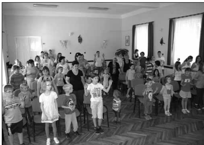
Gyereknapi a Művelődési Házban