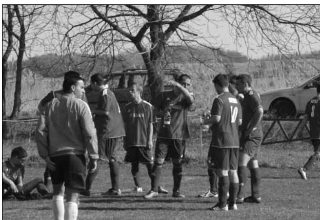
A csapategységre lehet építeni az eredményes szereplést

A TAO pályázatnak, Kápolnáért Kulturális és Sport Egyesületnek, Sitke Község Önkormányzatának köszönhetően a tavaszi rajtot megszépült öltözővel, új sport felszereléssel gazda-