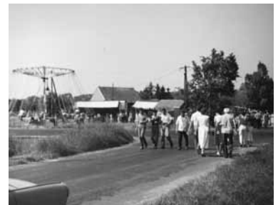
Sitkei búcsú régen