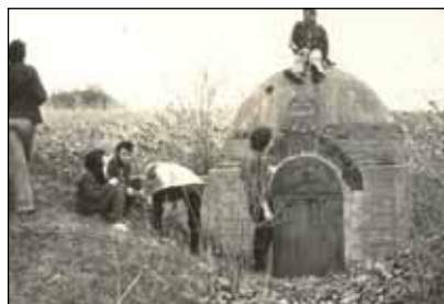
Kirándulás a Kiskútnál. Itt még láthatóan jó állapotban van az építmény.

Az orosz hadifoglyok a Lánka patak forrásvíze fölé, közel Kurcon majorhoz szép kupolaszerű épületet emeltek, amelyet Sitke község lakói Kiskútnak, mások Kalapos kútnak neveztek el. A forrás környékét parkosították, platánfákat, vadgesztenyefákat ültettek köré. A tisztavízű forrás előbb a hadifoglyok szükségletét elégítette ki, a