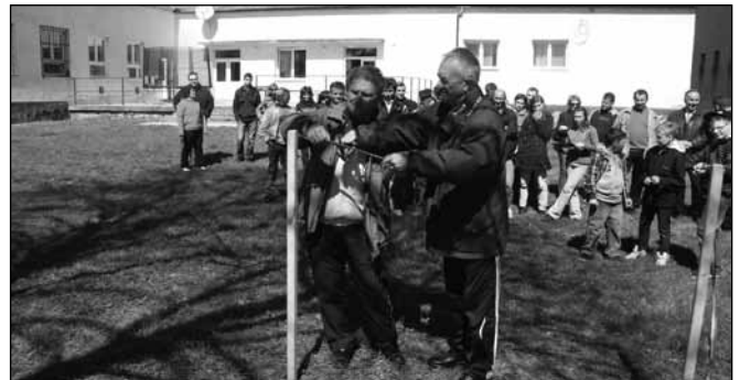
Újabb sportlétesítménnyel gazdagodott Sitke

Legnagyobb sajnálatunkra a gyerekek csapata nem talált kihívóra, pedig a nyári gyermektáborok legnépszerűbb versenye az elmúlt 8 évben a petanque volt. A háromfős csapatok (persze póttagokkal is erősített néhány csapat)