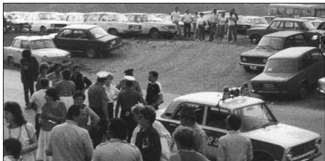
Reményvan arra, hogy a parkolással kapcsolatos problémák végre megoldódnak

A jubileumi koncert sikeresen, anyagilag is nyereségesen zaj-