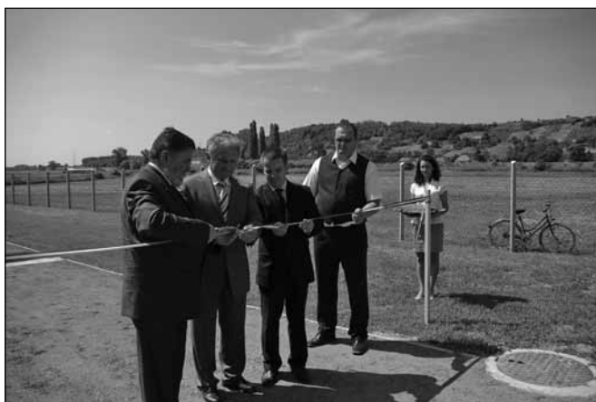
Sitke község szennyvízhálózatának és tisztítóművének ünnepélyes átadása

A rendezvény a szennyvíztisztító telep megtekintésével és sajtótájékoztatóval egybekötött fogadással zárult.