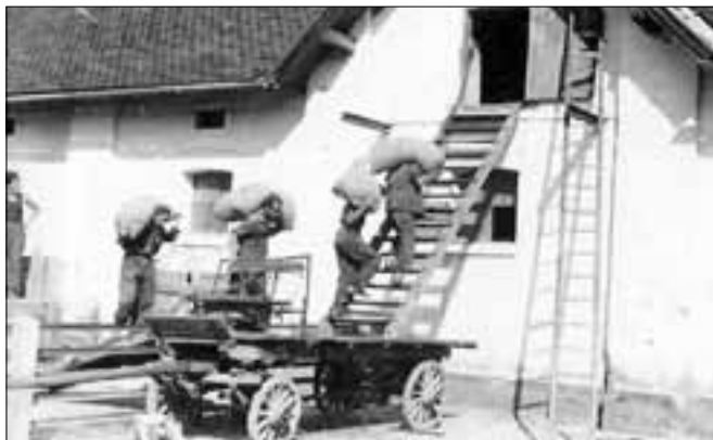
Nehéz fizikai munkát végeztek a "zsákulók"