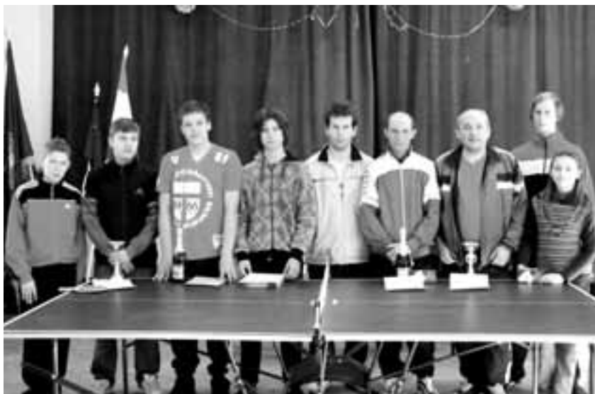
Az asztalitenisz verseny résztvevői