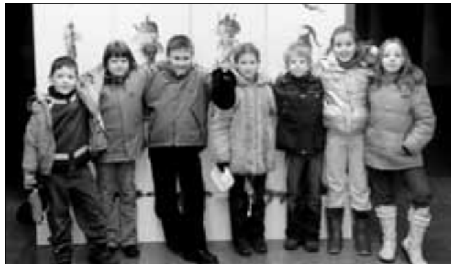
Akik legyőzték a Könyvirtó Koboldot