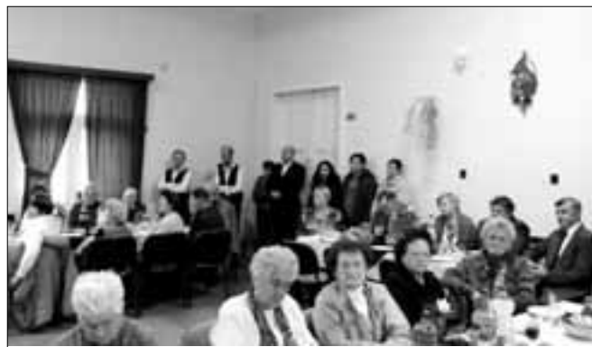
Az önkormányzat az Idősek napján köszönti a falu 70 év feletti polgárait

A citerások műsorával zárult a program hivatalos része, majd felszolgálásra került a finom étel, amelyet jó étvágyal fogyaszt-