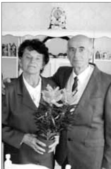
Lábasék az 50. házassági évfordulón