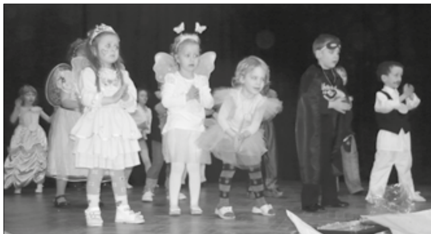
Jelmezbe bújt óvodások a Művelődési ház színpadán

Ez a fajta alakoskodás hazánkban a 15. század óta ismert. Jellegzetes dunántúli népszokás pl. a kislejárási, a kislejárási készítése. A sitkei óvodások is minden évben elégetik a Bölönt-ér partján a te-