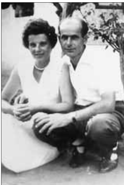
A fiatal pár Sitkén a Zrínyi utcai házuk udvarán