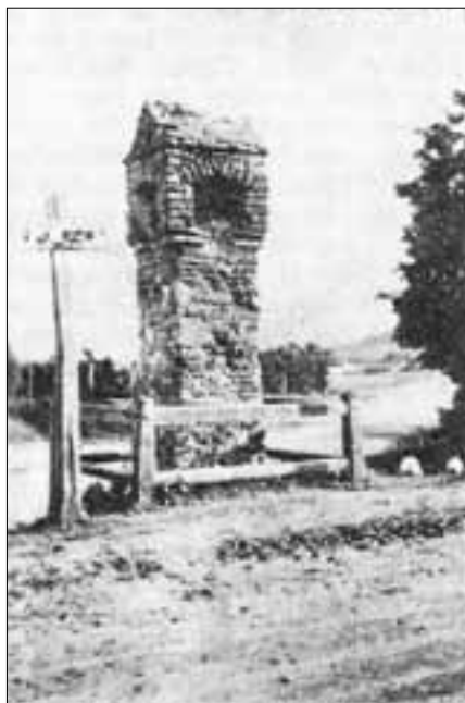
A nagysitkei XV. sz.-i kegyeleti emlékmű a helyreállítás előtt

Itt születtem én e Kemenesi tájon. Gyönyörű vidék ez, Olyan, mint az álom.