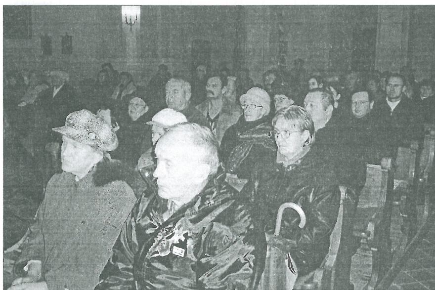
Kápolnáért Kulturális és Sportegyesület szervezésében a Savaria Szinfonikus Zenekar Vonósnégyese Adventi koncertet adott nagy érdeklődés mellett a sitkei templomban

pogányos varázscselekedetek, különösen szerelmi varázslások sokasága is fűződött hozzá. Rorate előtt minden ólat, istállót be kellett zárni, mivel harangozás előtt jártak a boszorkányok. Ha az eladósorban lévő leány hajnalban három kis darabot leté-