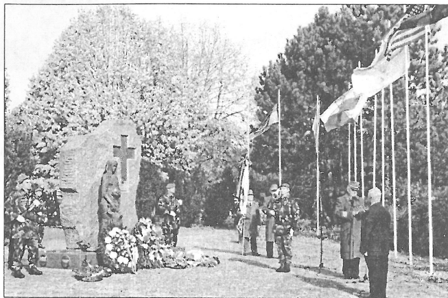
Tizenkilencedik alkalommal emlékeztek meg a két világháború hőseiről és áldozatairól