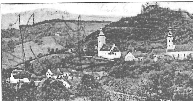
Vasdobra (ma: Neuhaus am Klausenbach /Burgenland, Ausztria) látképe, balra a katolikus templommal, egy 1902-ből való postai képeslapon