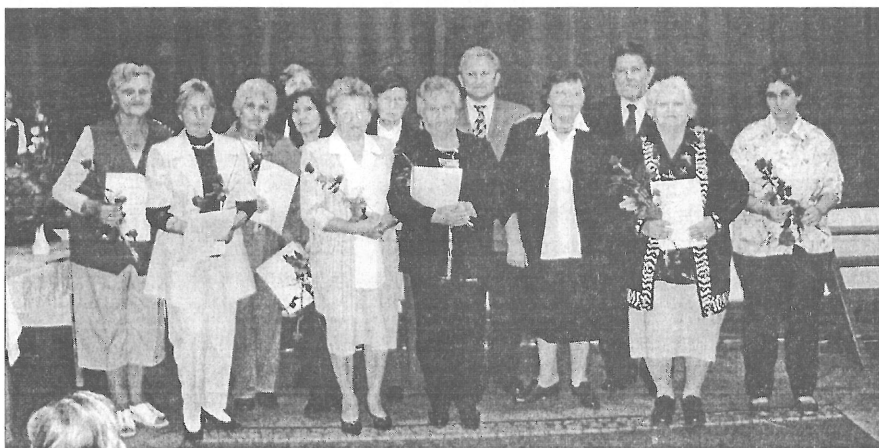
Ünnepelt a Díszítőművészeti Szakkör

Elsősorban helyben, de részt veszünk megyei, regionális és országos kiállításokon is, Szombathelyen, Győrött, Zalaegerszegen, Mezőkövesden, Békéscsabán, legutóbb Bögötre és Jákra kaptunk meghívást. El kell mondanom, hogy egy-egy ilyen kiállítás nagy és fáradságos munka. Összegyűjteni, felcímkézni, a helyszínen az installációt elkészíteni, vasalni, felrakni, feliratozni a kiállítani szánt anyagot nagyon sok energiát és időt igényel.