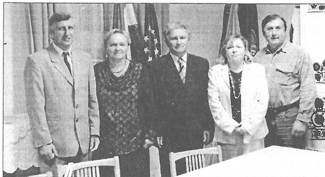
Az új képviselő-testület