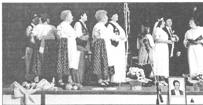
A Sorkifaludi Nefelejcs Női Kar

Következő fellépő az Ifjúsági Citerazenekar volt, tagjai 1996 óta játszanak együtt. Azt hiszem, egy együttes életében nincs legfelemelőbb érzés,