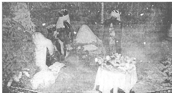
Betlehem az Emlékparkban

Megkezdődött az egyházi év, a karácsonyi ünnepkör, a megtestesülés misztériumának bevezetése. A magyar nyelv Úrjövetelek is nevezi ezt az időt. Az advent csak azután keletkezett, amikor az egyházban az 5. századtól kezdve általánossá lett a karácsony megünneplése. VII. Gergely pápa szabályozta azt oly módon, hogy négy vasárnapon, a karácsonyt megelőző négy hétben határozta meg az adventi időszakot. Ez gyakorlatilag azt jelenti, hogy Szent András apostol ünnepéhez (november 30-hoz) legközelebb eső vasárnap az advent első vasárnapja. Ekkor a templomokban és a vallásos családokban meggyújtják az adventi koszorú első gyertyáját. Adventkor a 19–20. század óta szokás koszorút készíteni. Az adventi koszorú őseit 1839-ben német Johann H. Wichern evangélikus lelkész készítette el: egy felfüggesztett székkeréken 23 gyertyát helyezett el, melyek közül minden nap eggyel többet gyújtott meg karácsonyig. A világító gyertyák számának növekedése szimbolizálja a növekvő fényt, amelyet Isten Jézusban a várakozónak ad karácsonykor. Minden gyertya szimbolizál egy fogalmat: hit, remény, szeretet, öröm. A gyertyák egyben a katolikus szimbolika szerint egy-egy személyre vagy közösségre is utalnak: