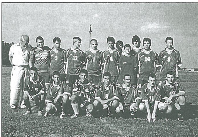
Az ifjúsági csapat

kezdődött, majd szabadtéri terepfutással folytatódott. A hétközi edzések továbbra sem megoldottak, így maradnak az előkészületi mérkőzések, amelyek a következőképp alakulnak: február 22.: Jánosháza-Sitke, február 28.: Sitke-Rábaty, március 6.: Sitke-Káld, március 7.: Sitke-Gérce.