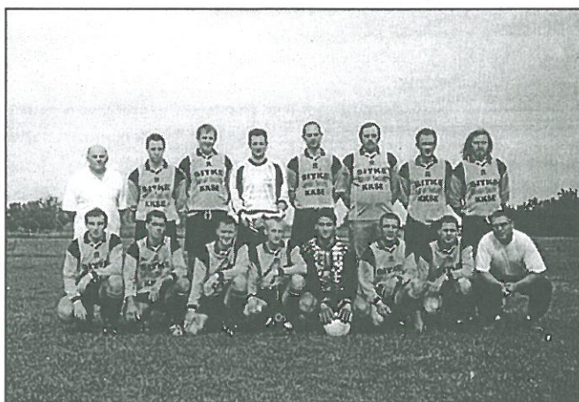
A felnőtt csapat