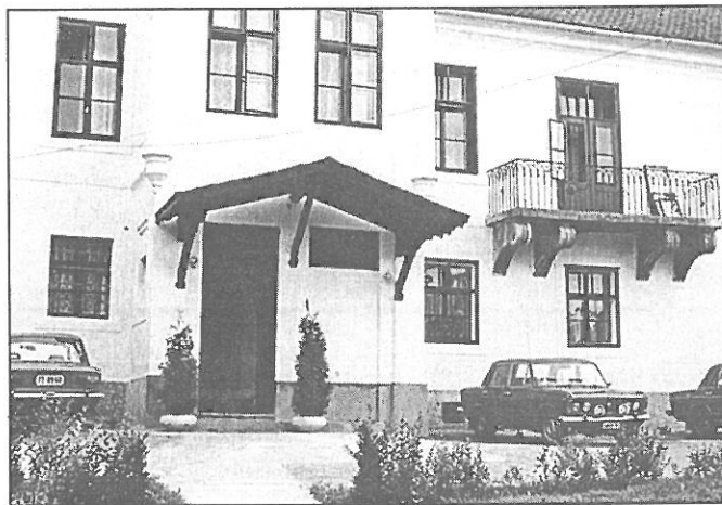
A felújított kastély