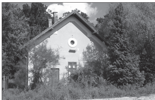
Talán lesz vállalkozó, aki lát lehetőséget a vasútállomás épületének megmentésében

A 60-as években Zalabér és Sárvár között naponta öt vonatpár közlekedett. A Sárvár és Sitke közötti 8 km-es távolságot 13 perc alatt tette meg a vonat, ami azt mutatja, hogy a pálya nem volt megfelelő állapotban, korszerűtlen volt. Anyagi erő híján a megszüntetés kérdése került előtérbe. Egy 1973-ban