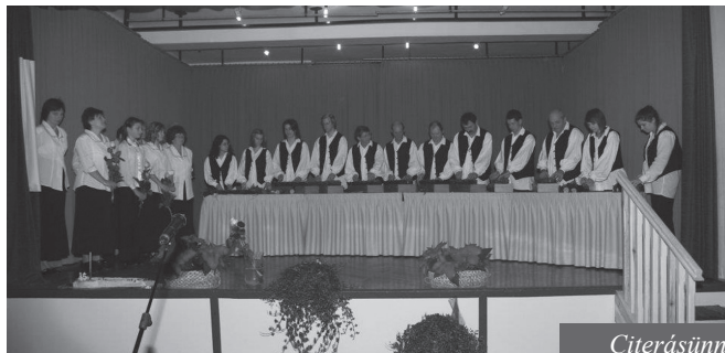
Citerásünnep telt ház előtt

* a rendezvény időpontja egyeztetés alatt