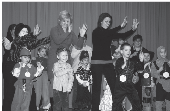
Karneváli hangulat, örömteli percek az óvodás farsangon