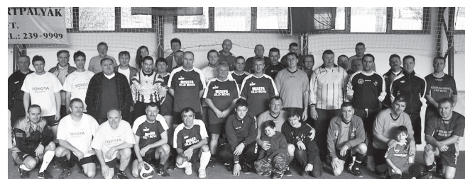
A labdarúgó torna mezőnye