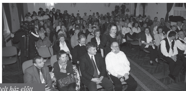
Morgós István polgármester