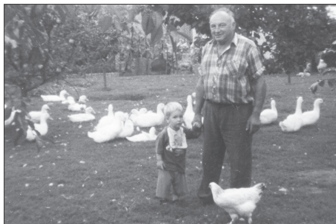
Feri bácsit az állatok szeretete a mai napig elkíséri

– Ez valóban így volt, hisz egyrészt abban az évben nősültem, másrészt abban az évben alakult meg a sitkei Tsz. A szüleimet sikerült beagítálni, de én akkor döntöttem el, ha a saját ökreinkkel nem szánthatok, akkor inkább elmegyek