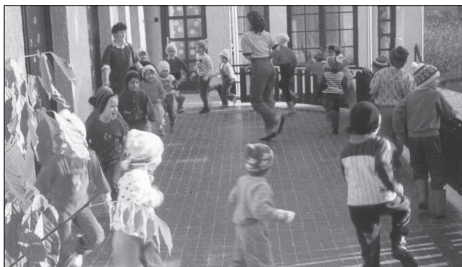
Az óvodai ellátás továbbra is önkormányzati feladat marad

2013. január 1-jétől lépnek majd hatályba az új törvény azon szakaszai, amelyek meghatározzák az új önkormányzati feladat és hatásköröket, ezeket a törvény 20 pontban foglalja össze: