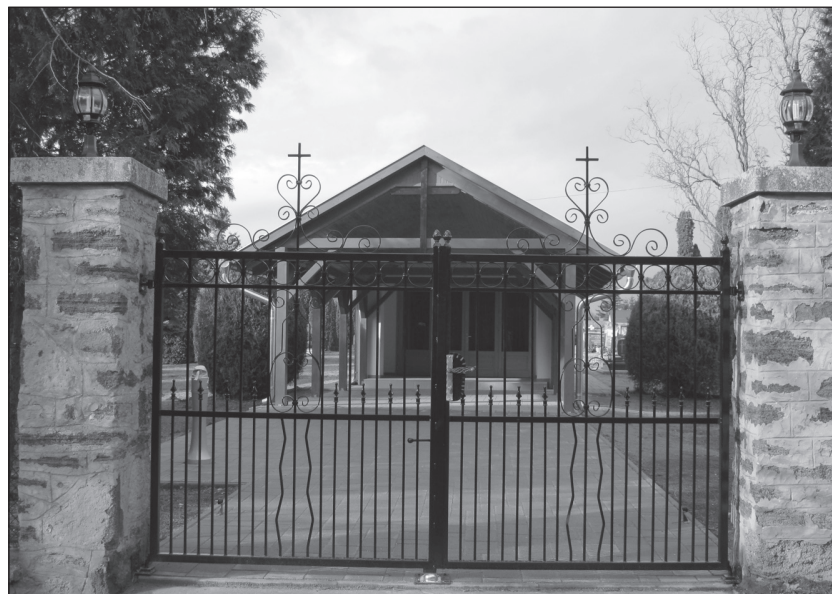
Pályázati pénzből újult meg a ravatalozó

2012. január végén tartotta idei első ülését Sitke község Önkormányzati Képviselő-testülete. Az elmúlt év végén már módosított köztisztaság fenntartásának rendjéről és a hulladékkezelési közszolgáltatásról szóló rendeletet ismételtelen módosítani kellett. A módosítást az indokolta, hogy a hulladékkezelési közszolgáltatási díj legmagasabb mértéke 2012. évben nem haladhatja meg a