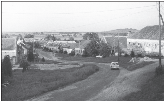
Kissitke, József Attila utca